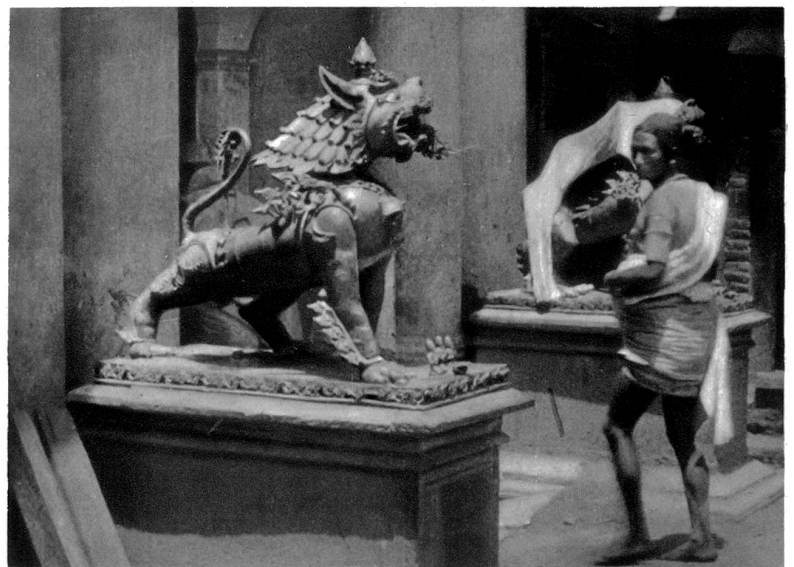
Tempeleingang in Katmandu