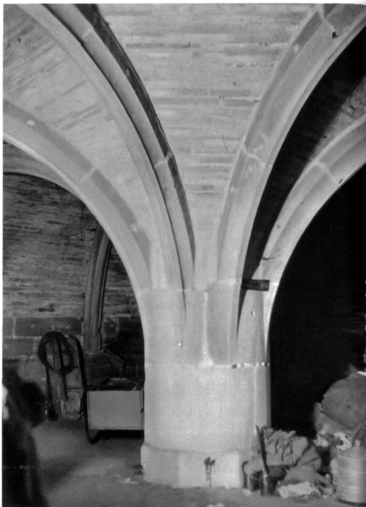
Eine mächtige Säule trägt das Gewölbe der Krypta