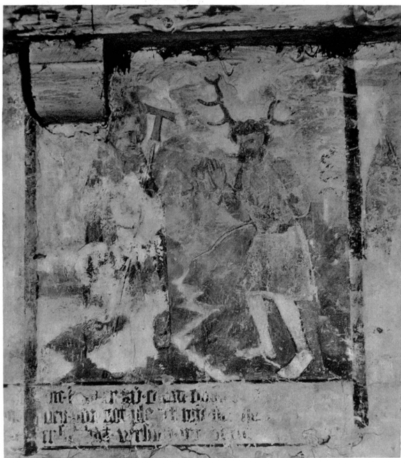
Die Kircheninnenwände waren mit Freskomalereien geschmückt