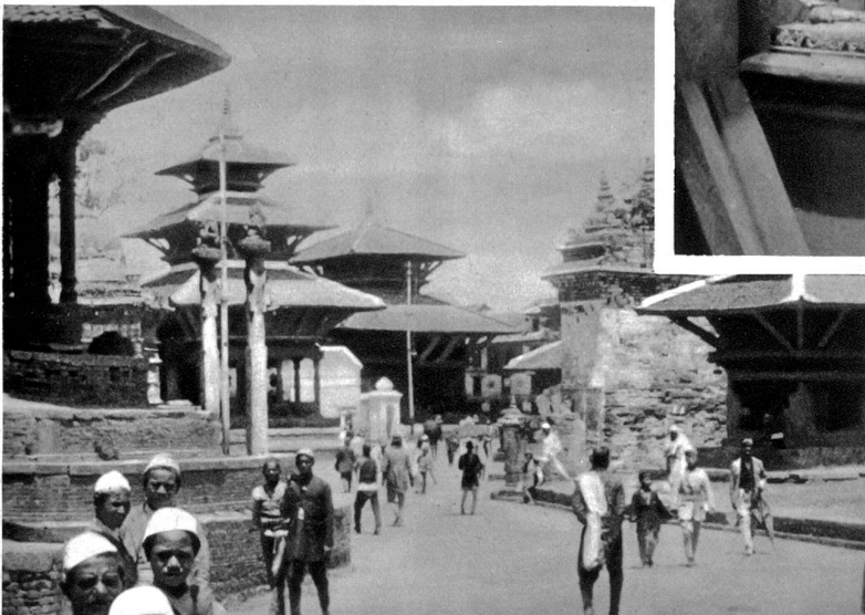
Tempelstrasse in der Hauptstadt Katmandu