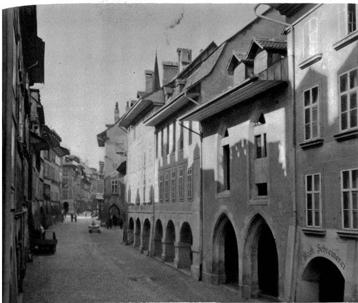
Blick in die Postgasse. Rechts das „Antonierhaus“, weiter oben die ehemalige Post, wo sich der erste Briefkasten Berns befand

Der Antonierorden wurde Ende des 11. Jahrhunderts in Bienne (Jfère, Frankreich) gegründet, nachdem eine dortige Kirche, in der die Gebeine des heil. Antonius aufbewahrt werden, zum Wallfahrtsort geworden ist. Die Gründung bezweckte hauptsächlich, in eigenem Spital sich der kranken, hilfeschenden Pilger anzunehmen. Die Reliquien des Heiligen sollten heilenden Einfluß auf eine, damals auch bei uns verbreitete, typhöse Krankheit, Antoniusfeuer genannt, haben, bei der die krankhaften Glieder, vom Brande ergriffen, meist verloren gingen. Durch die angeblichen Erfolge erlangte der Antonierorden große Ausdehnung. Das Ordensgebiet wurde in 369 Komtureien eingeteilt, von denen zwei mit den Ordenshäusern Burgdorf und Bern in das Gebiet der Landschaft Bern reichten.