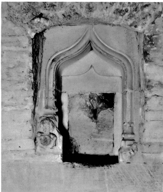
Die des Heiligenbildes beraubte Nische in der Krypta