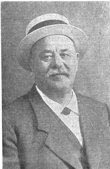
† Fritz Wüthrich-Bärtschi

In Langnau wurde am Neujahrstage um die Mittagszeit ein Meteor beobachtet, das einer silbernen Kugel gleich, über den Wald und über den Bösacker flog und über Mittel-Altenei erlosch. Das gleiche Phänomen wurde übrigens auch über Interlaken beobachtet, wo es die Farbe eines elektrischen Glühlichtes hatte.