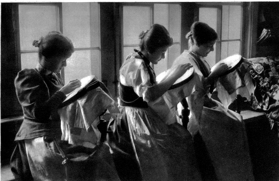
Stickerinnen aus der Ostschweiz