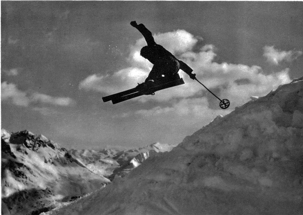
Ein schöner Quersprung