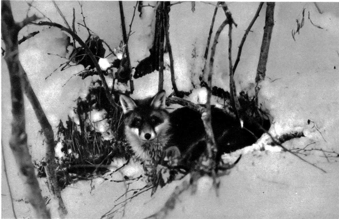
Jungfuchs auf der Fährte