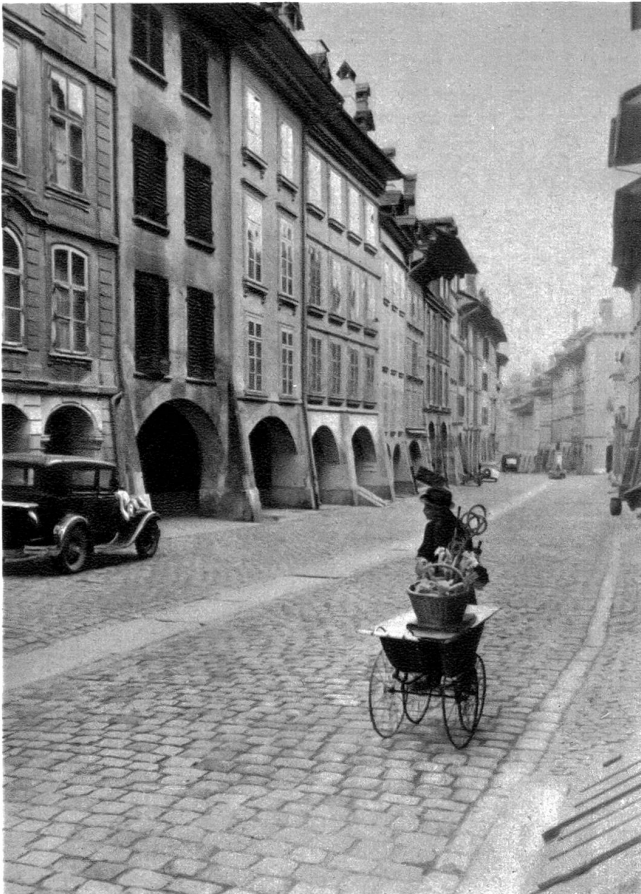
Das sog. Gespensterhaus, dessen Läden geschlossen sind