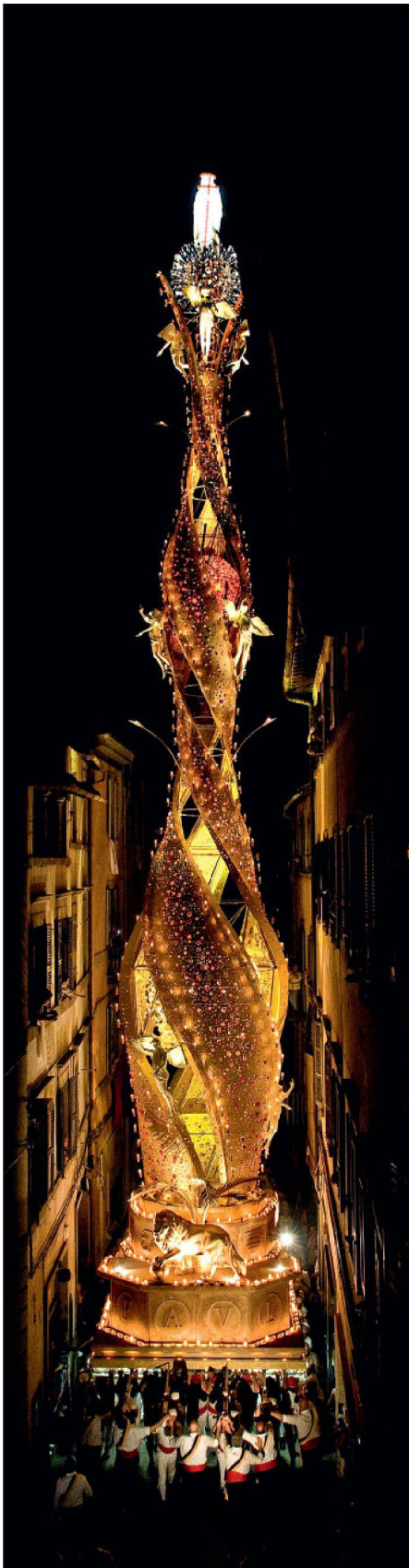
01 LED und Kerzen beleuchten «La Macchina di Santa Rosa»

Jedes Jahr tragen die Bewohner von Viterbo (I) ihre Stadtheilige Santa Rosa auf einer beeindruckenden Säule durch die Stadt. Die diesjährige, 30 m hohe Leichtbaukonstruktion verbindet traditionelle Kerzenbeleuchtung mit modernen LED.