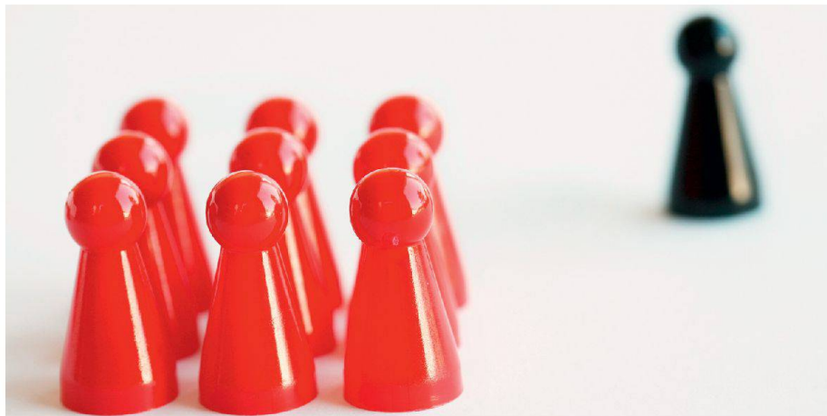
01 Mobbing am Arbeitsplatz: Schaden für Opfer und Arbeitgeber

Mobbing, Bossing, Cyberbullying und Co.: Die einschlägige Forschung identifiziert immer weitere psychosoziale Belastungen. Mit einer neuen Website soll wissenschaftlich fundiert und fortlaufend über diese Erkenntnisse informiert werden.