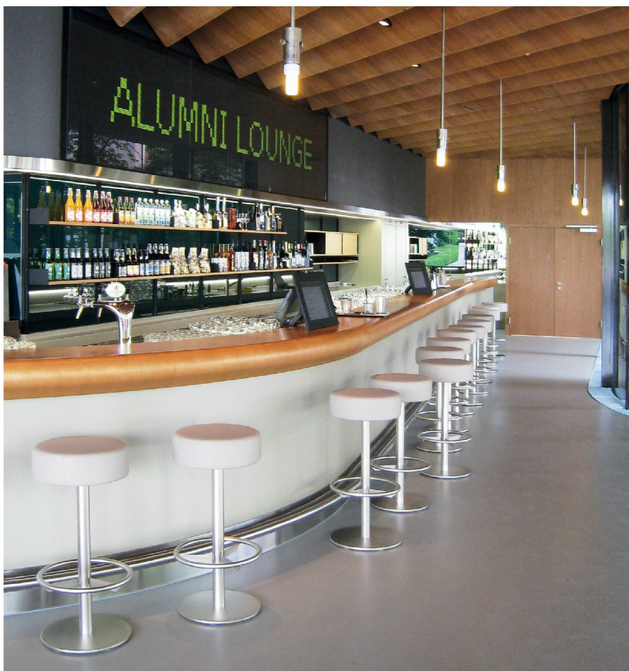
01 Die geschwungene Theke ist das Rückgrat der Lounge