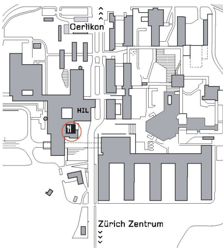
03 Situation Science City, rot eingekreist die neue Lounge

auf Dieter Rams «Regalsystem 606» von 1960 in mattschwarz eloxiertem Metall und Eichenholz.