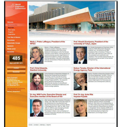
01 Screenshot der WEC-2011-Website www.wec2011.ch

WEC 2011 bleiben möchte, hat die Möglichkeit, sich auf der Website zu registrieren.