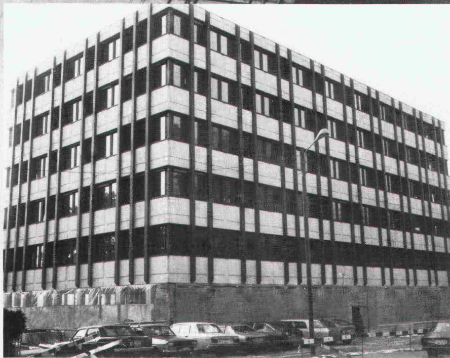
Verwaltungs- und Geschäftsgebäude der Publicitas AG, Lausanne. Dieses Bauvorhaben war bei der WAADT versichert.