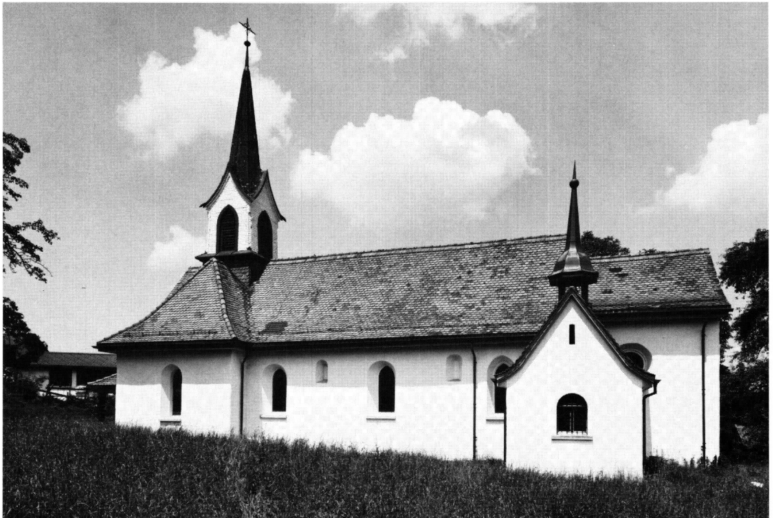
Abbildung 1: Die Kapelle St. Konrad und Ulrich von Süden

Die archäologischen Untersuchungen haben nun den Nachweis erbringen können, dass sich der Gründungsbau