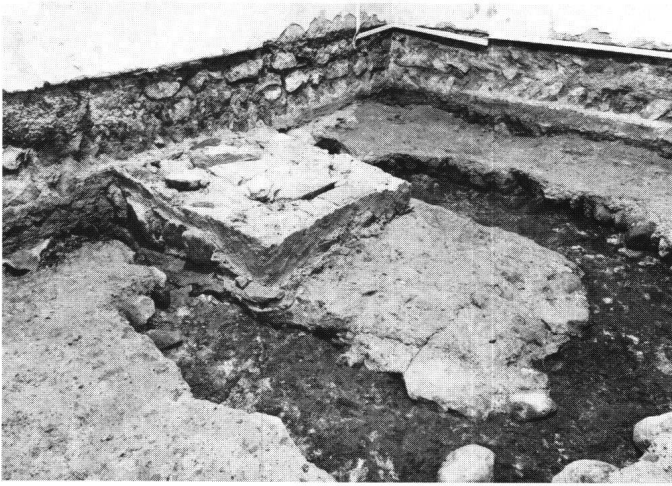
Abbildung 2: Der Chor gegen Südosten. Sichtbar sind neben dem ursprünglichen Mörtelboden ein jüngerer Altarstipes sowie die Substruktionen einer dazugehörigen Altarstufe.

der Kapelle in der Bausubstanz weitgehend erhalten hat. Lediglich die Westwand, deren Fundamente gefasst werden konnten, ist 1915 bei der Errichtung eines Westanbaus niedergelegt worden. Die Kapelle wies ursprünglich je einen Eingang im Westen der Nordwand und im Osten der Süd wand auf. Bekannt sind ferner zwei hochsitzende Rundbogenfenster auf der Südseite, die ebenfalls zum originalen Bestand gehören dürften. Baugeschichtliche Beobachtungen dazu fehlen jedoch.