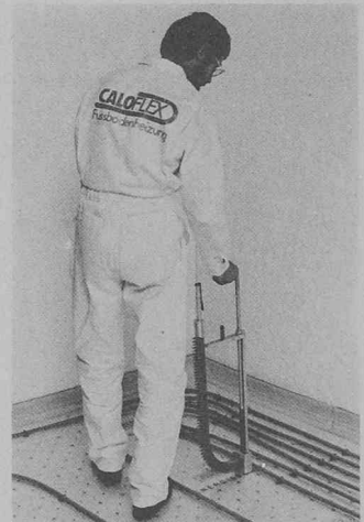
Caloflex Energiesysteme AG, 8600 Dübendorf

sen Wärmeautonomie auch für den Einbau verbrauchabhängiger Wärmemessgeräte. Die als Montageplatte konzipierte Isolationsplatte des Energiebodens erlaubt eine schnelle und saubere Befestigung der Rohre (Bild). Mit einem speziellen Schiessapparat werden die Rohrhalterklemmen direkt in die Montageplatte geschossen. Dadurch wird ein nachträgliches Verschieben der Rohre verhindert. Sinnvolle Energieeinsparung wird auch mit anderen Caloflex-Produkten praktiziert, beispielsweise mit den 1983 eingeführten Wärmehäusern oder dem Niedertemperatur-Heizkessel-System Heimax. Eine sinnvolle Ergänzung zu den mit tiefsten Temperaturen betriebenen Caloflex-Fussbodenheizungen.