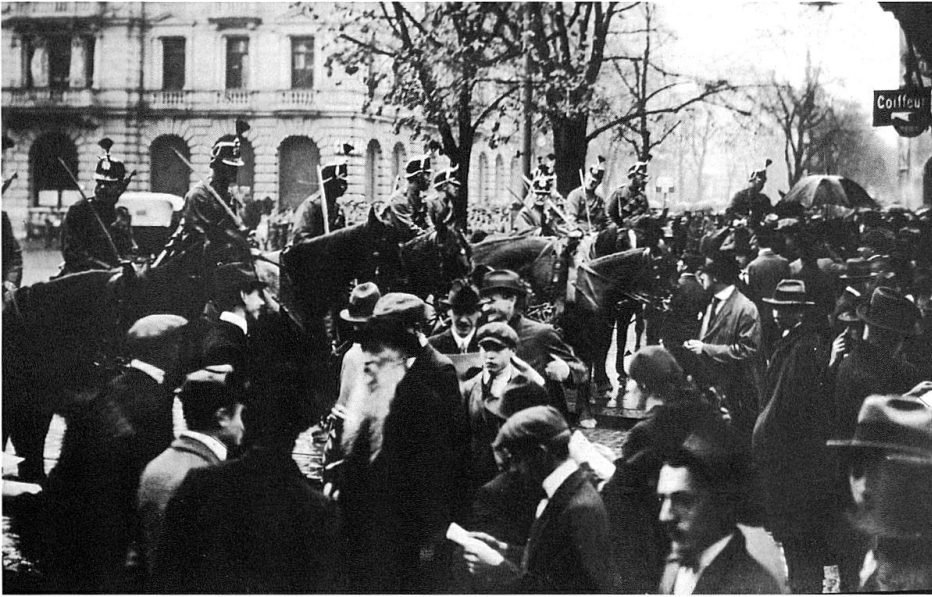
Kavallerie am Paradeplatz in Zürich, Generalstreik 1918.

Gebieten ausserhalb des Kantons, antwortet das Oltener Komitee mit einem 24-stündigen Proteststreik in Zürich und weiteren 18 Ortschaften. Er findet am 9. November statt, dem Tag der Ausrufung des Freistaates Bayern, der Revolution in Berlin und des Rücktritts des deutschen Kaisers.