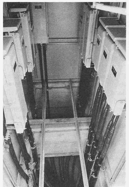
Bild 9. Kabelstützpunkt für Umschaltmöglichkeit im Störfall