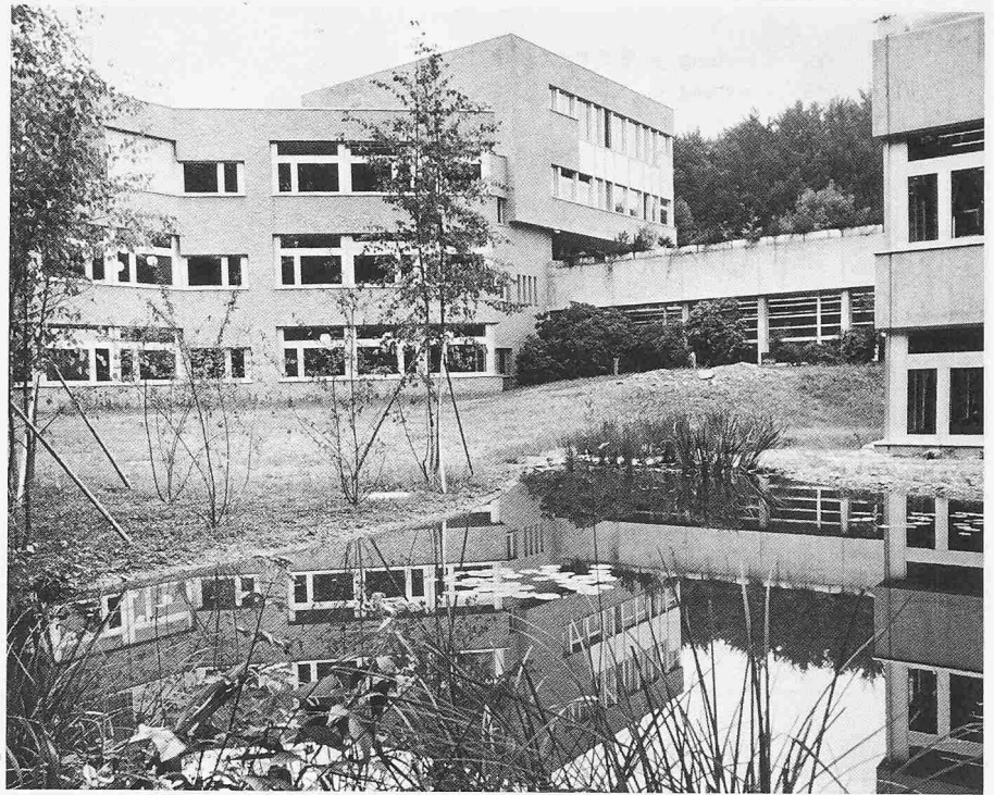
Bild 8. Schulhaus Juch vom Biotop her gesehen