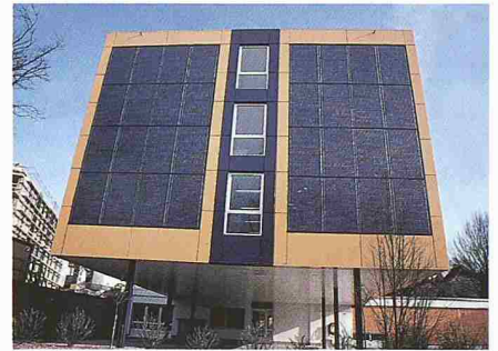
Photovoltaik-Fassade Rhodanie, Lausanne 2000. Planung: Seviles Industrielles de Lausanne

Peter Suter: Ja, die Förderung erfolgt nicht sehr stetig. Gut entwickelt haben sich andererseits in den letzten Jahren die