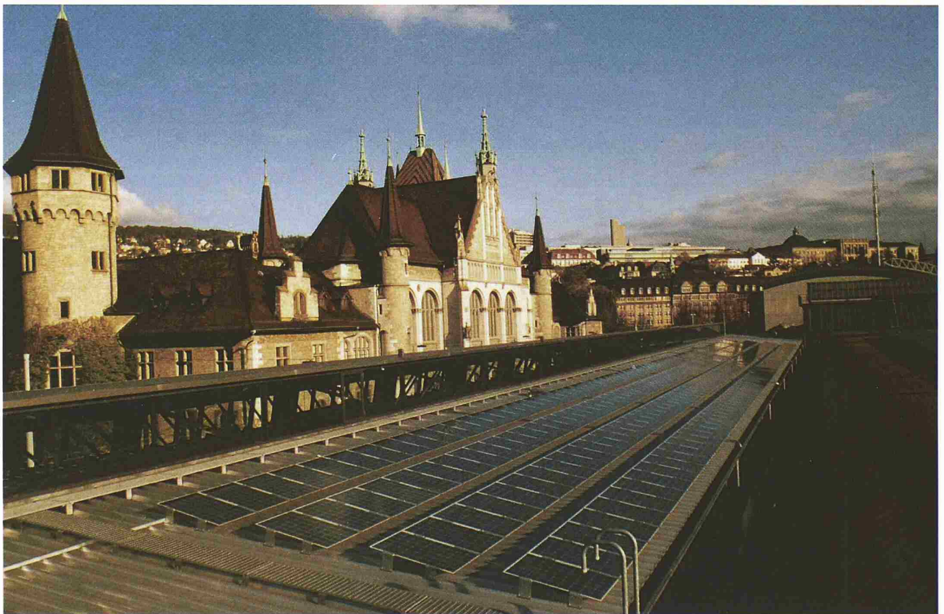
Solaranlage auf dem Hauptbahnhof Zürich, im Hintergrund das Landesmuseum

Lioba Schneemann: Also braucht es hier in der Schweiz gute Förderprogramme, wie etwa das 100 000-Dächer-Programm in Deutschland?