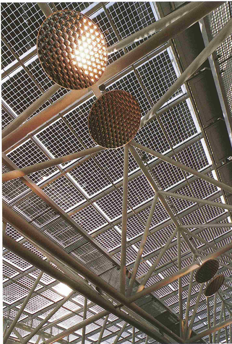
Migros Limmatplatz, Zürich 1999. Dachintegrierte 31 kWp-Anlage mit Photovoltaik-Isolierglas-Modulen. Planung: Energiebüro Zürich (Bild: Energiebüro Zürich)

Peter Suter: In der Schweiz sind vor allem grosse Anlagen wichtig. In Deutschland ist der Markt anders. Dort gibt es das 100 000-Dächer-Programm, bei dem viele Kleinanlagen gebaut werden. Um da Fuss zu fassen, braucht es ein Netz von Installationsbetrieben. Hier bauen wir zur