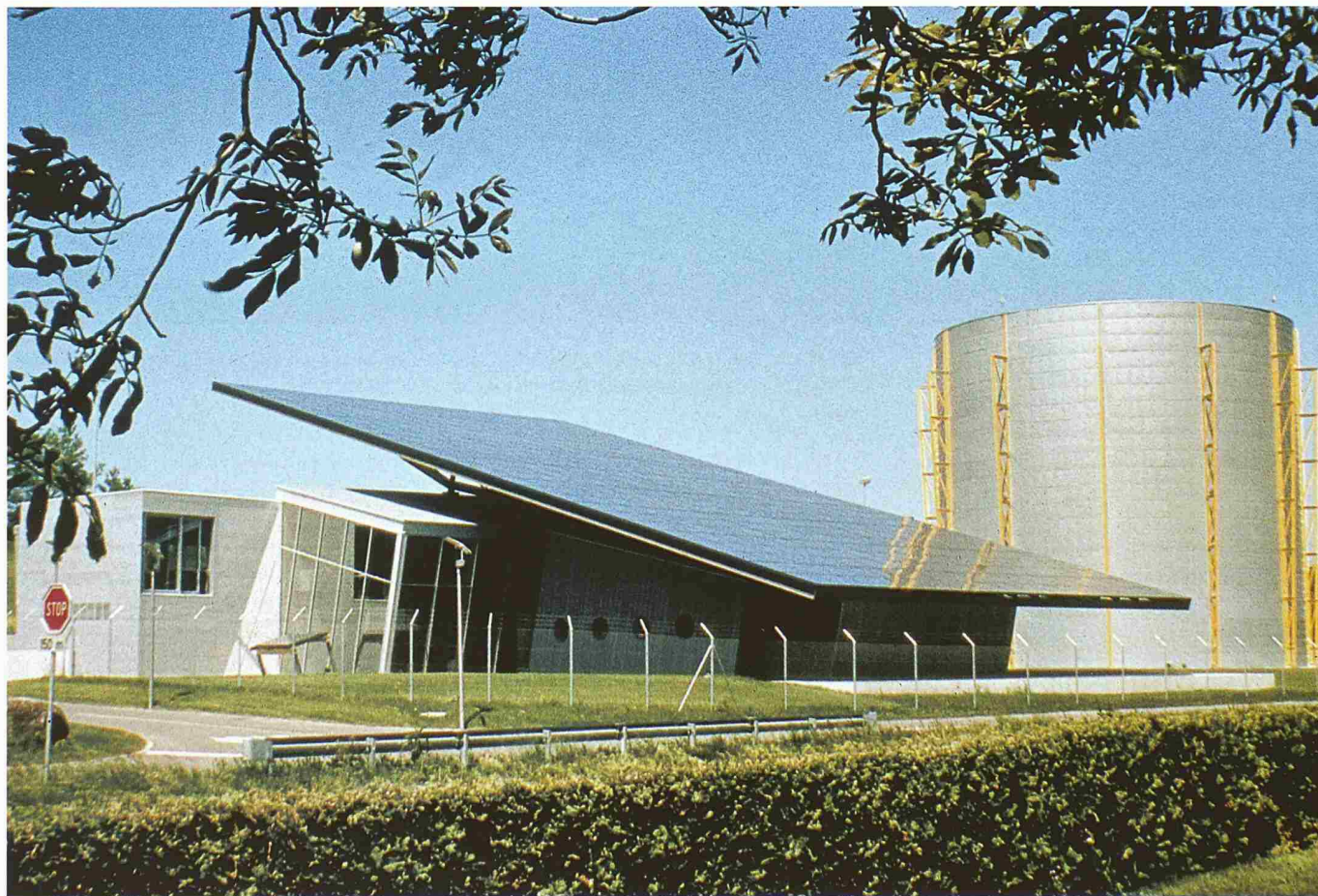
Flugsimulator Payerne 1995. Anlage: 105 kWp. Planung: Fabrisolar, Künsnacht