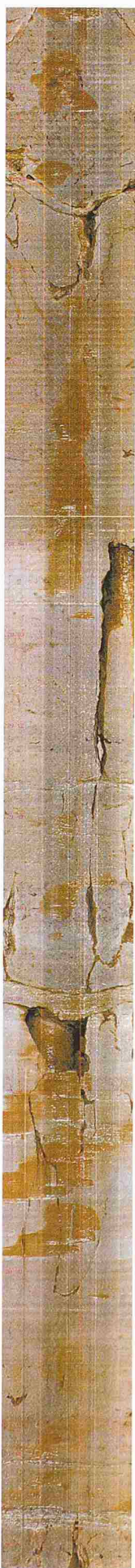
1 Die digitale Aufnahme einer Bohrlochwand in einem Kalkstein. In der Bildmitte schneidet eine fast senkrecht stehende Störung das Bohrloch