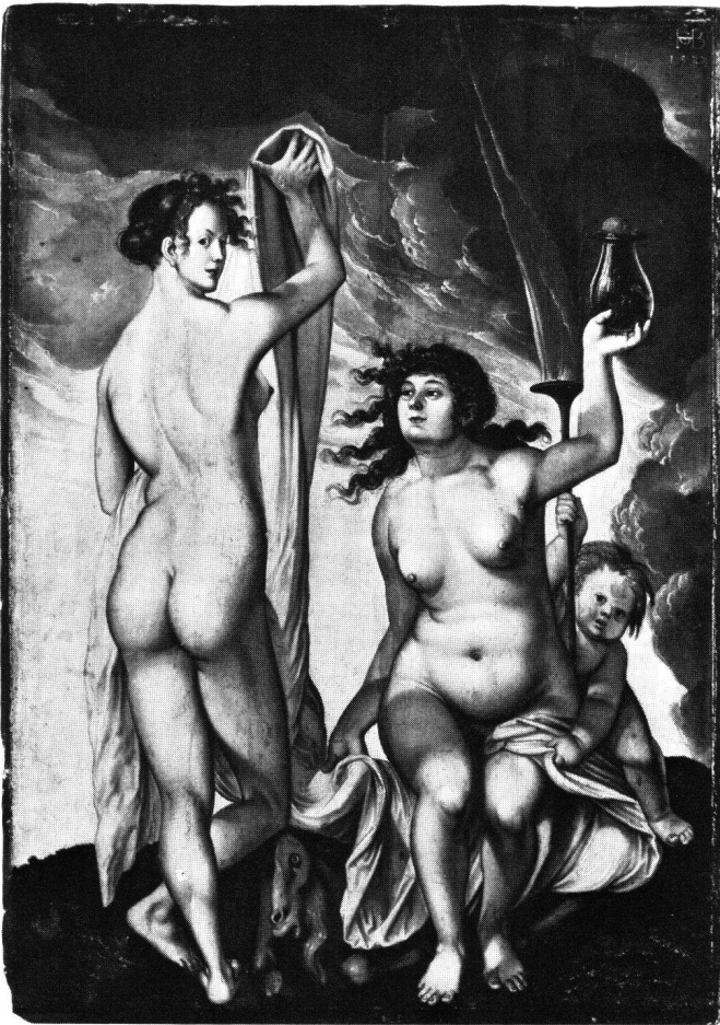
Abb. 6 Hans Baldung, Zwei Hexen. Tafelgemälde, datiert 1523. Städelsches Kunstinstitut, Frankfurt am Main

(Abb. 6). Wenn darauf unten nicht ein Pferdekopf anzeigend starrte, wären es einfach zwei nackte Frauen, eine junge vom Rücken her gesehen und eine voll erblühte sitzend, die zusammen ihre lockenden körperlichen Möglichkeiten vorweisen; ein Meisterwerk, das die Frage aufwirft, welches war seine Verwendung? War das ein Auftrag? Wer getraute sich damals, ein so magistrales, eindeutiges Stück aufzuhängen und so sich dazu zu bekennen? Gab es in Straßburg eine Gesellschaft oder einzelne, die sich außerhalb des zeitgebundenen sittlichen Rahmens bewegten? Im Vergleich dazu wirken die Paris-Urteile Cranachs harmlos in ihrer gespielten Naivität. Oder malte Baldung diese und andere Tafeln solcher Art (Abb. 7), weil er sich dazu getrieben fühlte, weil er es mußte – ganz gleich, was nachher daraus wurde, ob sie bei ihm blieben oder ob einer der Habitués, die vielleicht in seiner Werkstatt verkehrten, es wagte, «so ein Bild» zu sich zu nehmen? Hier tut sich ein bisher unbeachteter Bezirk der altdeutschen Malerei auf.