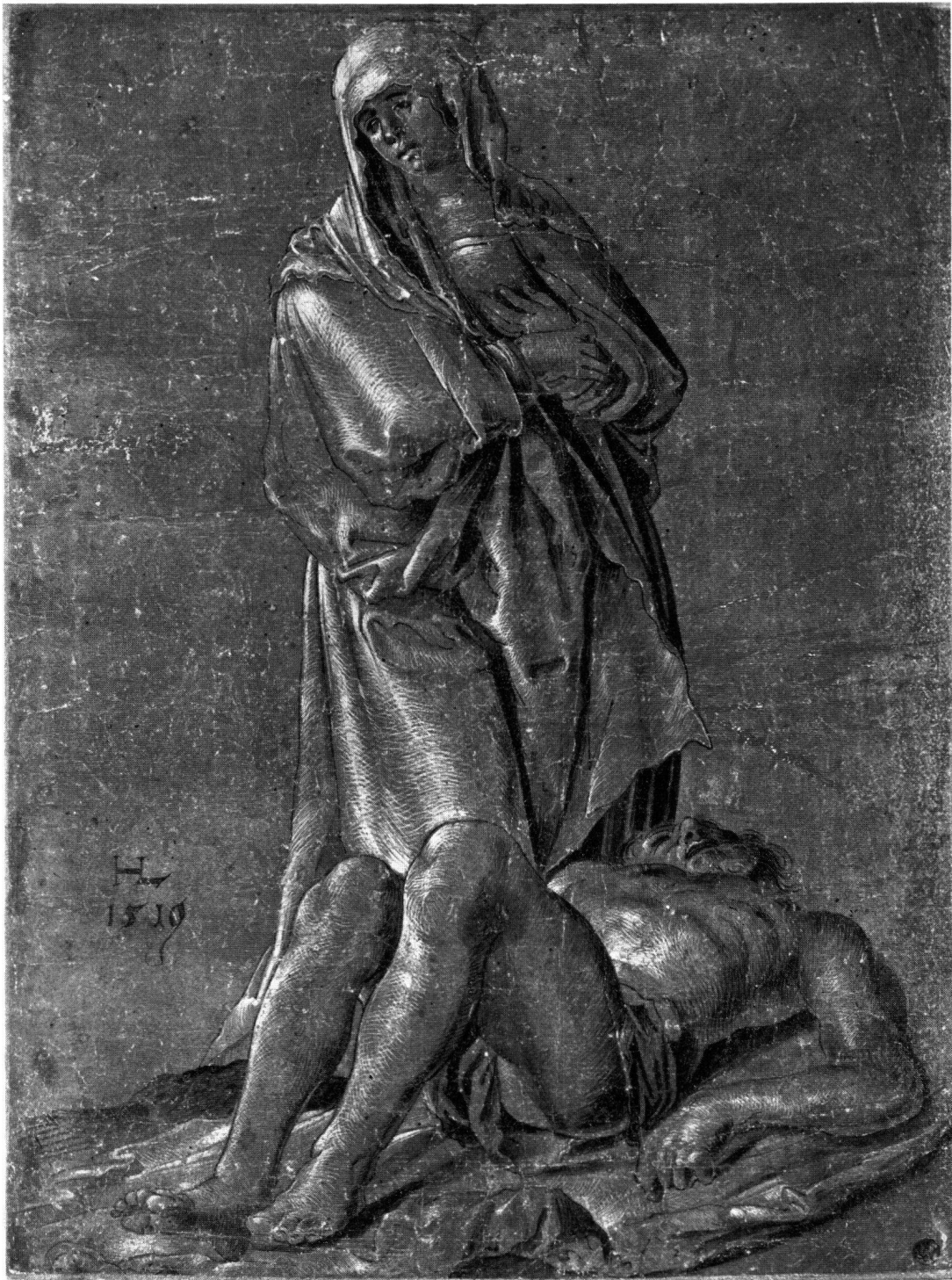
Abb. 1 Hans Leu d.J., Trauer der Maria über den toten Sohn. Feder auf grün grundiertem Papier, signiert HL, datiert 1519. Fogg Art Museum, Cambridge, Massachusetts

Nachlaß von Henry Oppenheimer in London versteigert und vom Fogg Fine Arts Museum in Cambridge, Massachusetts, erworben. Zuvor läßt sie sich in den bekannten Sammlungen Weigel, Lanna und Wauters nachweisen. Dabei galt sie schon damals, obwohl man noch kaum eine