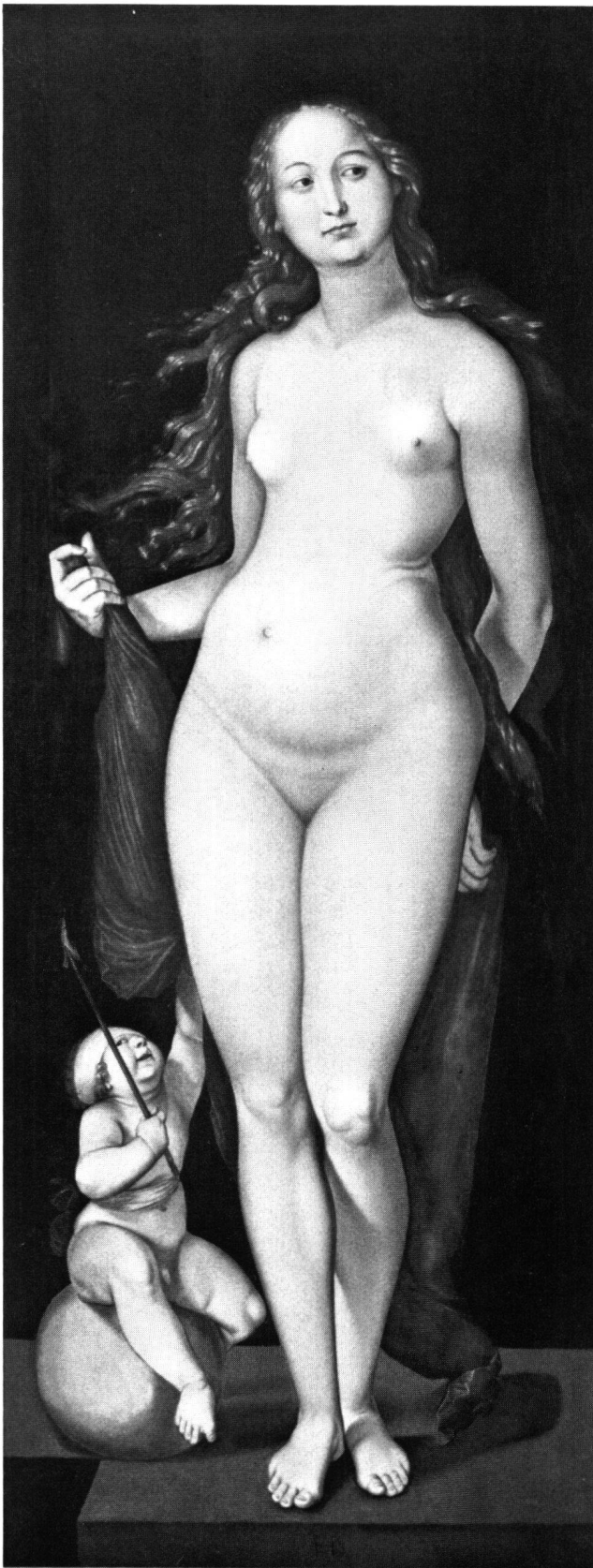
Abb. 7 Hans Baldung, Venus und Amor, datiert 1525. Rijksmuseum Kröller-Müller, Otterlo, Holland