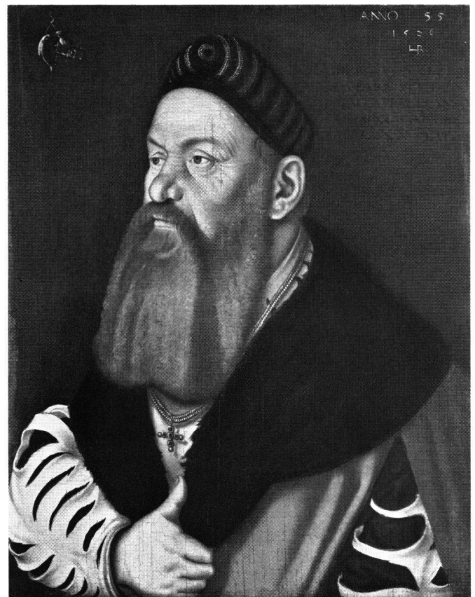
Abb. 8 Hans Baldung, Bildnis des Adelberg III. von Bärenfels, datiert 1526. Kunstmuseum Basel

Er begab sich auf die Suche nach dem geeigneten Platz zur Etablierung. 1509 ließ er sich in Straßburg nieder, erhielt gleich Aufträge für Altäre und Bildnisse und ent-