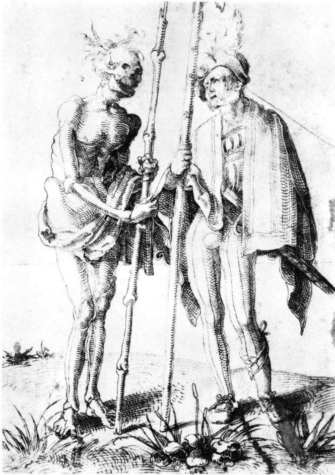
Abb. 3 Hans Baldung, Landsknecht und Tod. Federzeichnung, datiert 1503. Galleria Estense, Modena