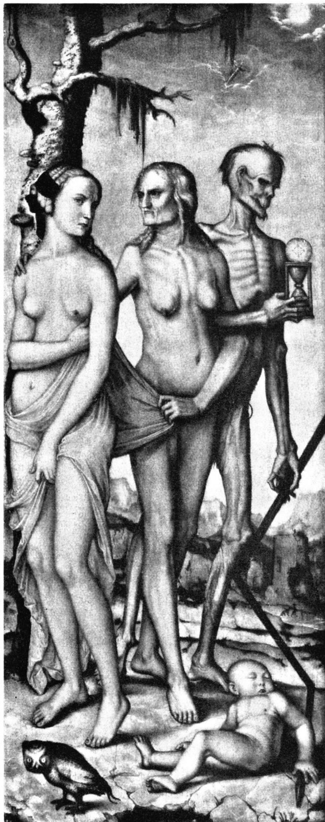
Abb. 10 Hans Baldung, Die drei Lebensalter und der Tod, gegen 1545. Prado, Madrid

Baldung hingegen hat sich den sozialen und geistigen Veränderungen seiner Zeit gestellt: Er hat auch, nachdem das Fundament seiner täglichen Arbeit ihm durch die Ereignisse der Reformationswirren entzogen worden war, nicht resigniert. Und er ist aus diesem schweren Kampf gereift und gewachsen hervorgegangen (Abb. 9). Die lebensgroße Venus der Sammlung Kröller-Müller in Otterlo (204 cm hoch, Abb. 7) ist ein großes Meisterwerk – kaum mehr altdeutsch zu nennen, aber von Baldung 1525 gemalt. Und die Lebensschau im Prado in Madrid (Abb. 10), vorgeführt an den Lebensstufen des Weibes und mit dem Tode schließend, vermittelt eine düster-großartige Weltauffassung von stoischer Größe. Sie ist Baldungs menschliches und künstlerisches Testament – es ist weit entfernt von den lächelnden Marien von 1510.