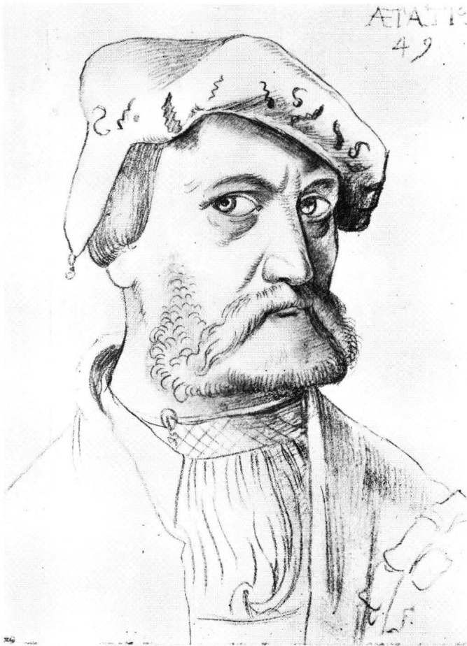
Abb. 9 Hans Baldung, Selbstbildnis im Alter von 49 Jahren (1534). Schwarze Kreide. Musée du Louvre, Paris

wickelte als Maler wie als Holzschneider eine erstaunlich umfangreiche Tätigkeit, was ihm Wohlstand eintrug. Dürer dürfte er seither nicht mehr gesehen haben. Doch hielt ihn wohl dessen außerordentlich reiche Tätigkeit für den Kupferstich wie für den Holzschnitt über seinen künstlerischen Weg auf dem laufenden. Es mag auch sein, daß Hans Leu, der nach ihm zu Dürer kam, auf dem Rückweg nach Zürich sich zu ihm begab und ihm von Dürers Schaffen erzählte. Das dürfte um 1511 etwa gewesen sein. Lange kann Leu allerdings nicht in Nürnberg geblieben sein, denn zu Hause erwartete ihn die nach dem frühen Tode des Vaters verwaiste Werkstatt.