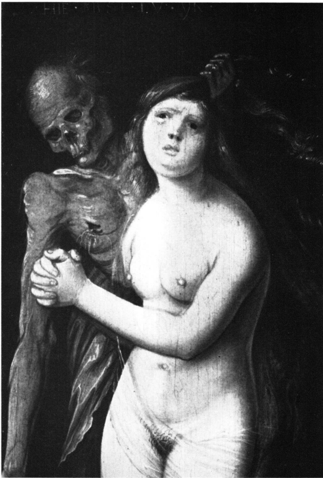
Abb. 9 Hans Baldung Grien: Der Tod und das Mädchen. 1517. Ausschnitt, Infrarotaufnahme von 1956. Kunstmuseum Basel