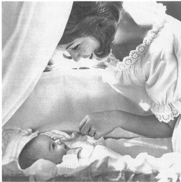
Abb. 5: Glückliche Mutter bei der Firma Wander, 1963. (Dr. A. Wander AG [wie Anm. 19], 11)

liebevolle Pflege ihres Kindes beweist die Mutter ihr Verantwortungsbewusstsein dem Schöpfer gegenüber und auch ihre Dankbarkeit für das kostbare Gut, das ihr anvertraut ist.» 22