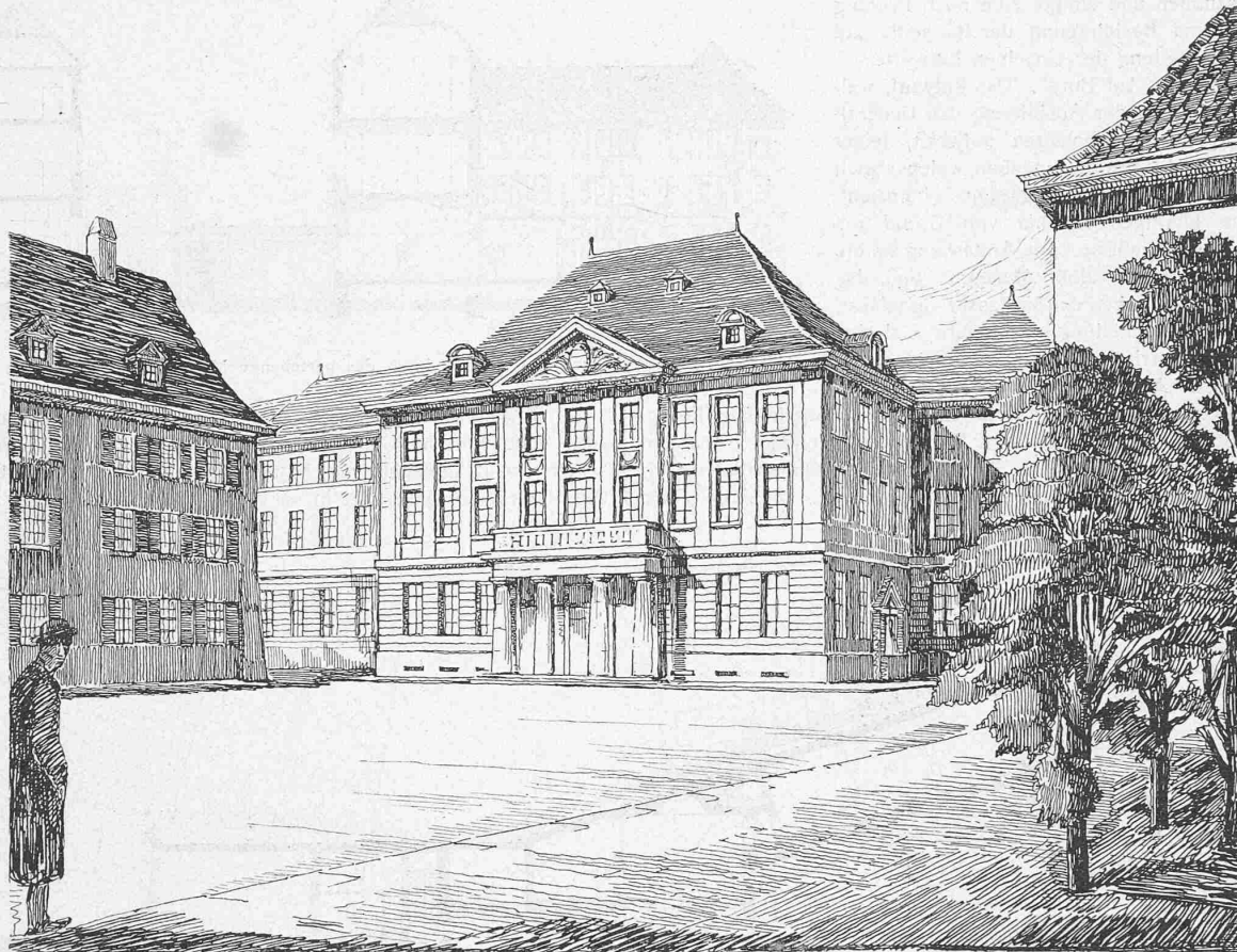
I. Preis. Motto: «Cumbuc». — Verfasser: Eduard, E. B. und P. Vischer , Architekten in Basel. Fassade des ausgebauten Museums am Münsterplatz.