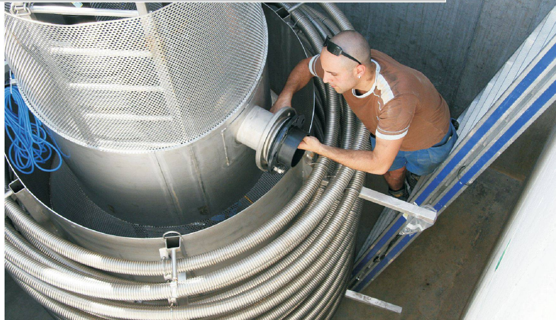
WELLNESS / SPA