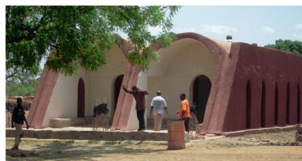
04 Sonderpreis: Öffentliche Einrichtungen in Mali; Emilio Caravatti, I-Monza