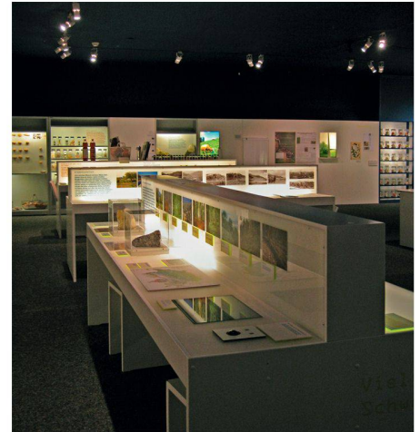
01 Verschiedene Stationen der Ausstellung laden die Besuchenden ein, sich interaktiv zu betätigen

Am Beispiel der Kartoffel wird verdeutlicht, dass uns die Artenvielfalt – bzw. deren Schwund – im täglichen Leben begegnet: Gab es Anfang des 20. Jahrhunderts in der Schweiz rund 250 verschiedene Kartoffelsorten, so sind es heute nur noch knapp 30. Neben der verlorenen Vielfalt auf unserem Speiseplan birgt dieser Rückgang auch ein Risiko für den Fortbestand der Art. Denn Vielfalt ist eine Art Lebensversicherung bei sich ändernden Umweltbedingungen, seien es ein Schädlingsbefall oder klimatische Veränderungen. Konzipiert wurde die Ausstellung vom Forum Biodiversität und den Naturhistorischen Museen Bern und Genf.