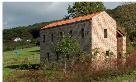
03 3. Preis: Einfamilienhaus in Hüttingen a. d. Kyll; Nikolaus Bienefeld, D-Swisttal-Odendorf