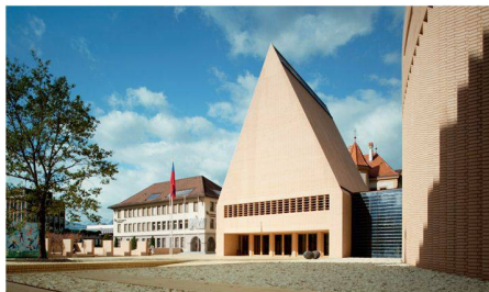
01 1. Preis: Parlament in Vaduz; HansjörgGörizt Architekturstudio, D-Berlin

bis Ende September 2010 Schweizer Baumuster-Centrale, Zürich