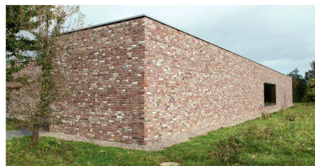
05 Sonderpreis: Architekturmuseum Hombroich; Álvaro Siza, PT-Porto; Rudolf Finsterwalder, D-Stephanskirchen