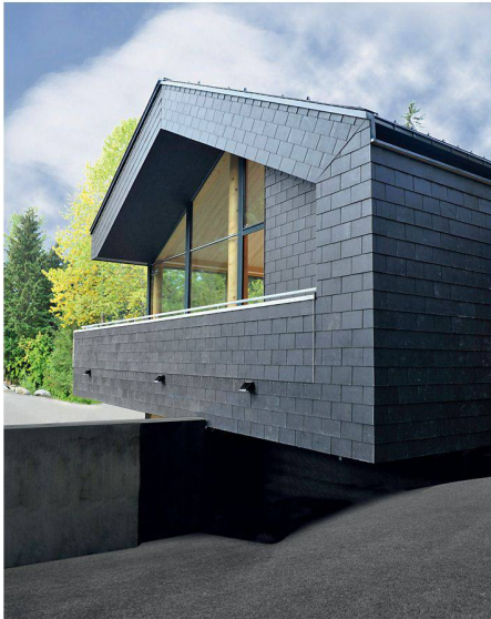
01 Ein Passivhaus im Blickpunkt der Weltöffentlichkeit: Das Österreich-Haus wurde für die Winterolympiade im kanadischen Whistler erstellt (Treberspurg und Partner Architekten)

An der 14. internationalen Passivhaustagung Ende Mai in Dresden konnte man feststellen, dass der Sanierungsbereich jedes Jahr einen etwas grösseren Raum einnimmt. Durchaus folgerichtig, denn die Bedeutung der baulichen Sanierung nimmt gegenüber dem Neubau generell zu, und hier stellen sich auch die grösseren Herausforderungen.