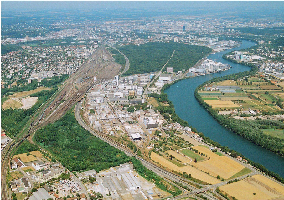
01 Problematik der grenzüberschreitenden Planung am Beispiel der zerschnittenen Räume bei Pratteln/Muttenz BL

Das Auseinanderklaffen der politisch-administrativen und der funktionalen Räume ist ein wesentlicher Grund für die unbefriedigende Siedlungsentwicklung. Die aktuelle räumliche Entwicklung und der veränderte Lebensstil erfordern neue Strategien – insbesondere auch das Planen über die Grenzen hinweg. Damit eine grenzüberschreitende Planung möglich wird, sind jedoch offene Fragen zu klären und muss eine neue Konflikt- und Kommunikationskultur etabliert werden.