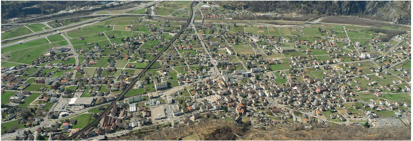
02 Herausforderungen der Siedlungsentwicklung am Beispiel von Biasca TI

Die vorgeschlagenen Massnahmen versprechen einen Beitrag zu den zwei erstgenannten Zielen, nämlich eine bessere Abstimmung der Planungen im grösseren Zusammenhang des Lebensraums Schweiz durch den Bund und die Kompensation neuer Bauzonen durch die Reduktion bestehender. Denn: weil wir genügend Bauzonen haben, besteht in der Summe kein Mangel. Offen ist bei diesem Ansatz jedoch: Wie funktioniert ein Bauzonen-Markt, der an richtigen Standorten das Bauen ermöglicht? Werden die für die Bebauung optimalen Lagen dadurch verteuert?