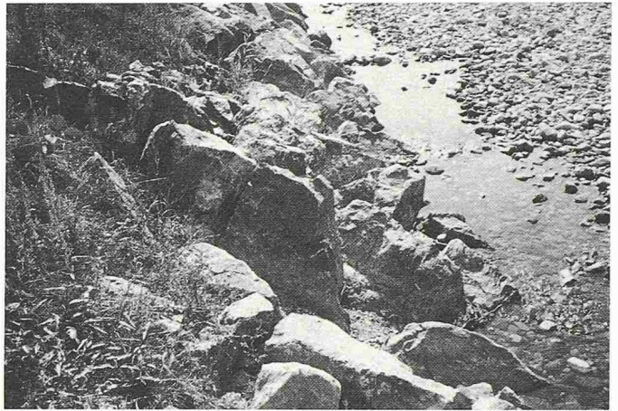
Bild 4. Naturgemässe Felsbankbauweise

sorgen, dass die Massnahmen unter Beachtung ökologischer und flussbaulicher Erfordernisse ausgeführt werden.