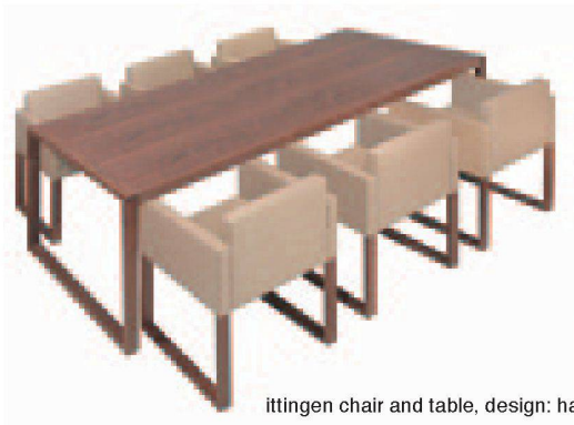
ittingen chair and table, design: harder spreymann, 2009