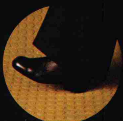
hoher, sicherer Gehkomfort