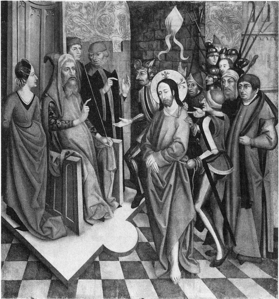
Abb. 5. Christus vor Pilatus, Holz, 137 × 126 cm, Augustinermuseum Freiburg i. Br.

Austreibung der Teufel und die Vertreibung Christi aus dem Tempel; rechts innen die Taufe Christi und das Martyrium des Evangelisten Johannes, außen das kanaanäische Weib, die Speisung der Fünftausend und der Einzug in Jerusalem (Bischöflicher Besitz St. Gallen)