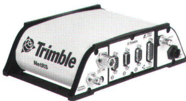
Trimble NetRS GPS Empfänger