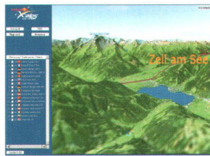
Abb. 2: Red Bull X-Alps, GPS-getrackte Fluglinien bei Zell am See. 3D-Ansicht basierend auf einem Satellitenbild.

Dank dem neuen DILAS OGC Web Map Server können GIS-Clients sämtlicher Hersteller, welche die «OpenGIS WMS»-Spezifikation unterstützen, sehr einfach und effizient an den DILAS SERVER angebunden werden. Damit ergänzt GEONOVA die bestehende Palette an systemspezifischen GIS-Clients für die DILAS-Umgebung (Intergraph, ESRI, GeoShop etc.). Die riesigen Rasterdatensätze in DILAS können damit einem breiten Spektrum an Nutzern im Intranet oder Internet kontrolliert zur Verfügung gestellt werden.