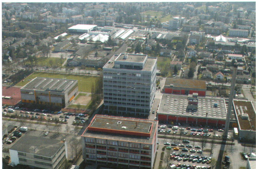
Abb. 3: FHBB 2003: Schulzentrum Gründenstrasse in Muttenz.

Prof. Karl Ammann Wanderstrasse 9 CH-4054 Basel karliammann@tiscalinet.ch