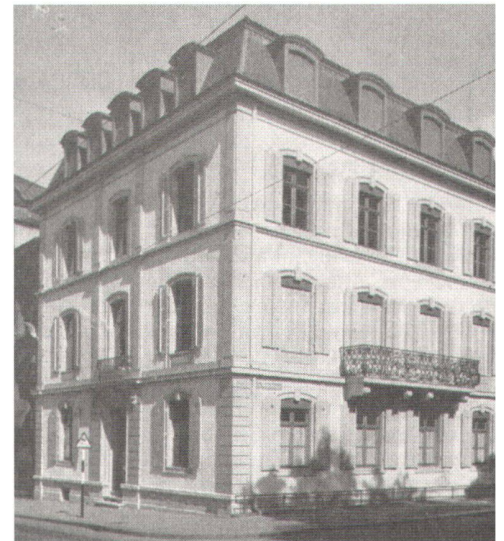
Abb. 1: Das Gründungs-Schulhaus an der Elisabethenstrasse 53 in Basel.

Die erste GPS-Kampagne der IBB in Brienz und im Val Colla.