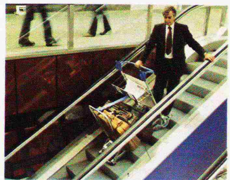
Bild 1. Rolltreppengängiger Gepäckrolli

eigens für den Bereich des ganzen Flughafens ein neuartiger, rolltreppengängiger Gepäckrolli geschaffen worden (Bild 1). Damit verlieren die Rolltreppen für den mit Gepäck beladenen Reisenden viel von ihrem Schrecken. Von Betriebsbeginn an stehen 1200 derartige Wagen im Flughafen zur Verfügung. Eine gemeinsame Organisation aller Flughafenpartner sorgt dafür, dass auf den Perrons und in den Ankunftsflughallen die nötige Anzahl von Rollis auf ihre Benutzer warten.