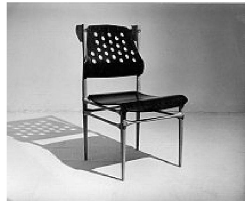
Stuhl Articulum von Edvard Ravnikar, 1952.