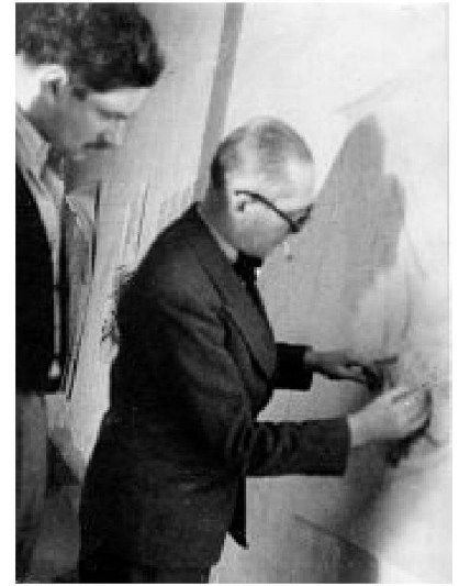
Architekt Marjan Tepina und Le Corbusier im Atelier in der Rue de Sèvres im Jahre 1939.