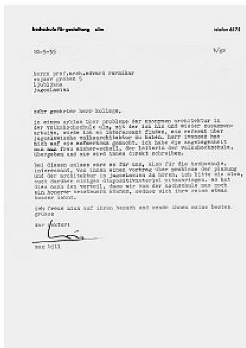
Brief von Max Bill an Edvard Ravnikar, aus dem Nachlass des Architekten Edvard Ravnikar.