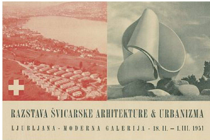
Plakat «Schweizer Architektur und Urbanismus» in der Moderna galerija, 1951.