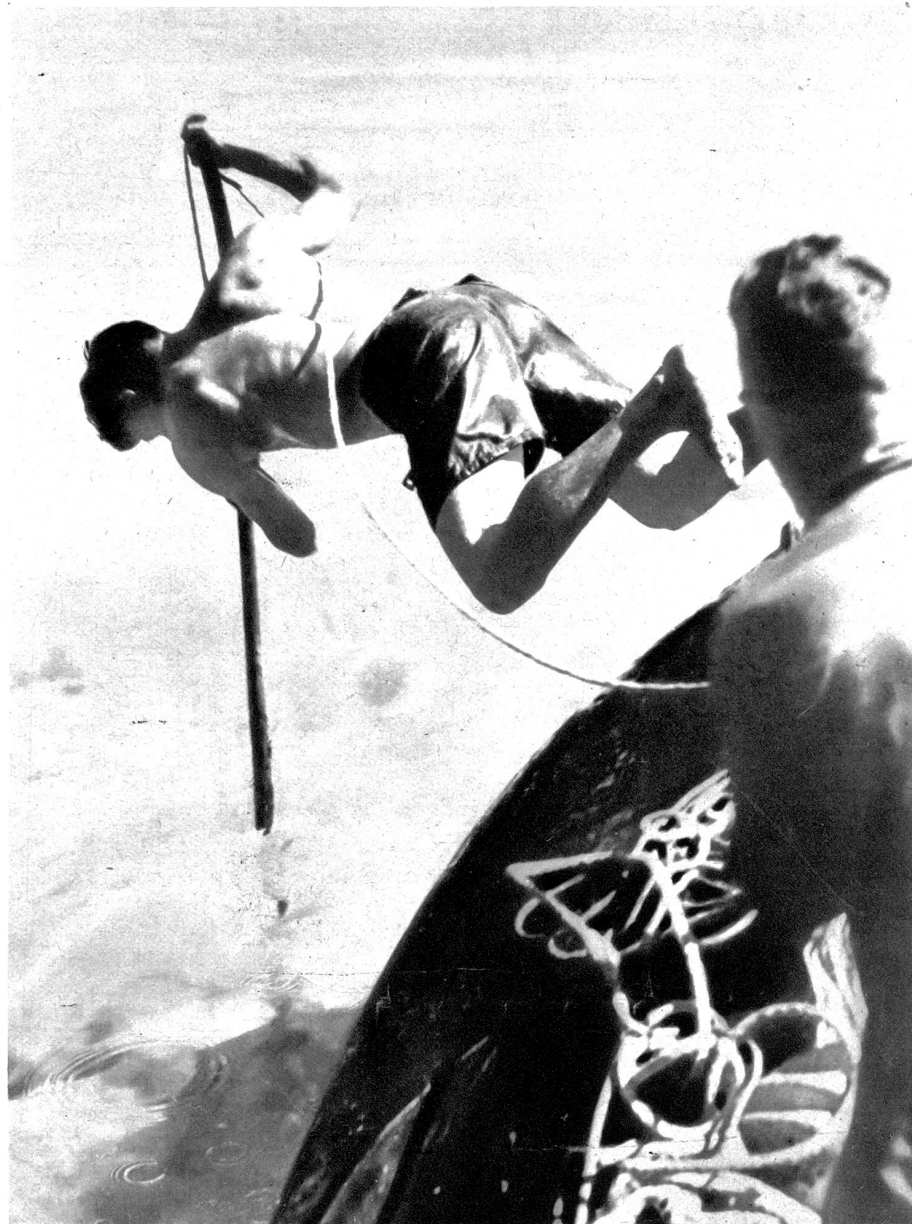
Turtlespearing heisst dieser aufregende Sport und bedeutet das Erlegen von Schildkröten unter Wasser