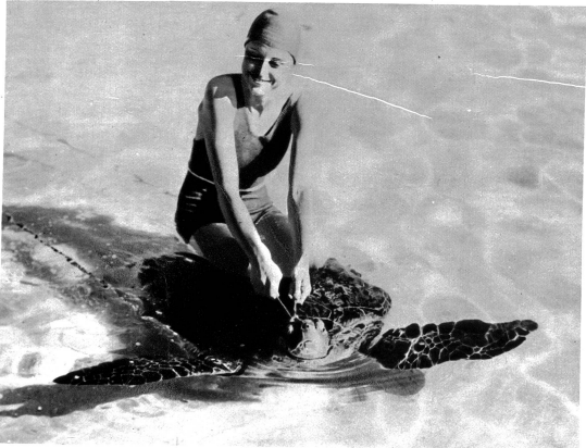
Das Reiten auf zahmen Schildkröten (gezähnten) ist ein Sport, der Geschick und Gleichgewichtssinn erfordert