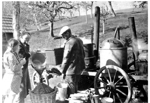
Der süße Moft wird in Korbflaschen abgefüllt