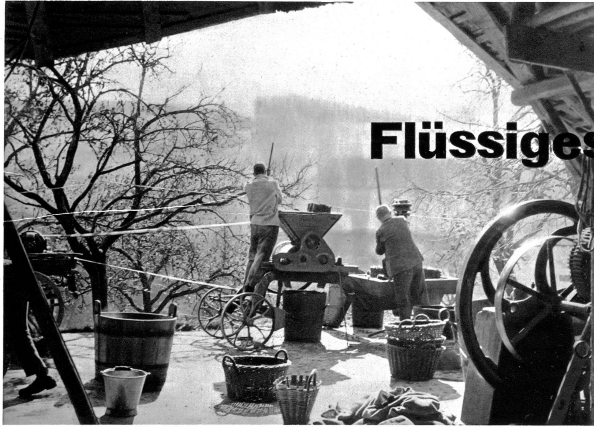
Hochbetrieb bei einem Emmentaler Bauernhaus