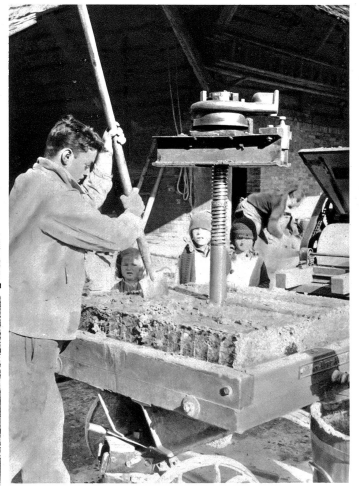
Die Rückstände, „Trester“ werden zerschnitten