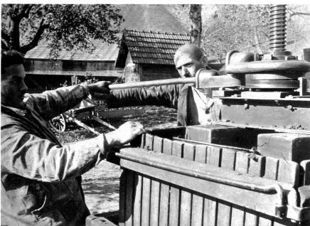
Immer heisst es noch: „mehr herausholen, mehr herauspressen!“

Würde man den frisch gepressten Fruchtmoft ohne weitere Behandlung in Flaschen füllen, dann würde bald eine Schärde in der Luft umherfliegenden Spaltpilze ihr Unwesen mit der Flüssigkeit treiben und sie je nach der Stärke der einen oder