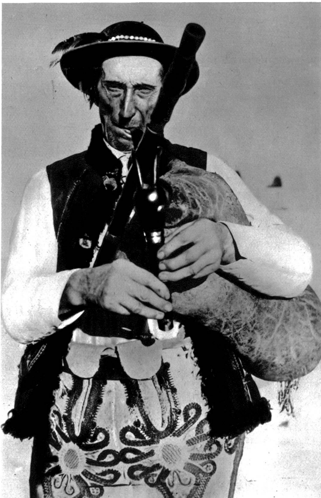
Ein alter Dudelsackpfeifer, ein Gorale (Bergbewohner in der Tatra) aus der Gegend von Zakopane