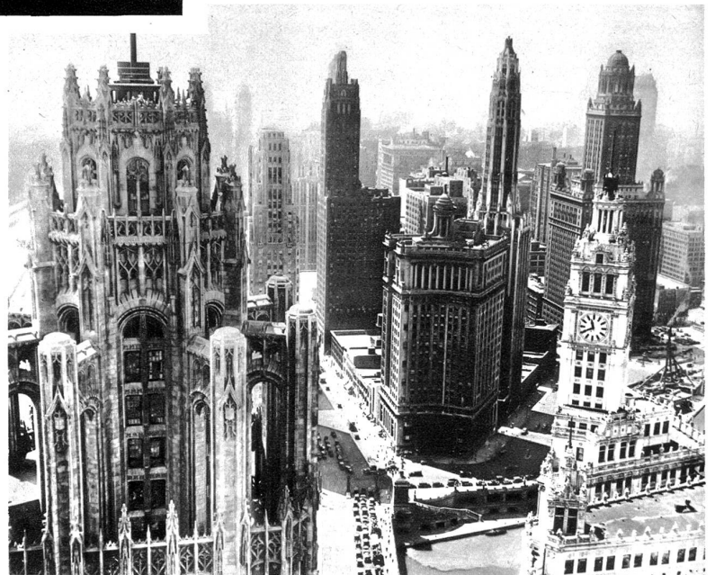
Chicago, die „Stadt der Türme“, ist in der letzten Zeit um einige Wolkenkratzer reicher geworden. Da die Stadt ein Wirtschaftszentrum für die Eisenindustrie, den Vieh- und Getreidehandel wie auch für die Holzindustrie ist, kann es sich Bauten leisten, die mit denen New Yorks in schärfsten Wettbewerb treten können. Die Architektur dieser Bauten ist höchst verschieden. Sie zeigt Beimischungen aus allen Stilen, von der Antike bis zur Neuzeit