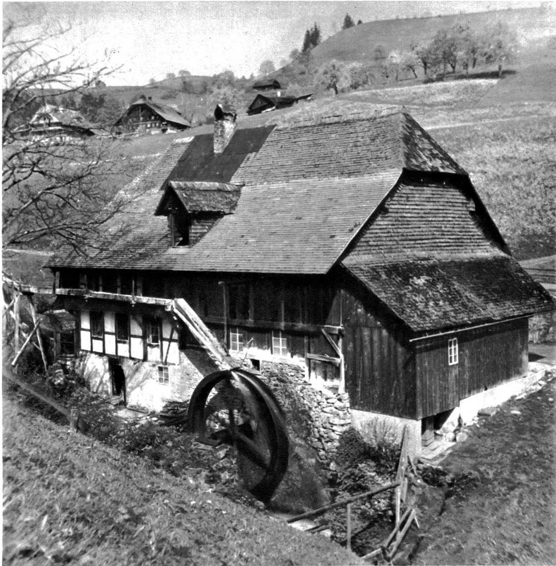
Die Mühle von Gambach im Kanton Bern. Wie aus Urkunden hervorgeht, besteht die Mühle schon an die 500 Jahre. Zählte man in der Schweiz vor 40 Jahren noch 2400 Handmühlen, so sind es heute nur mehr deren 800, davon sind bloss 220 Kleinmühlen mit Wasserrad, die andern sind Grossmühlen mit Motorkraft

besteht aus vier Mann. Wenn einer aus diesem Quartett bei Arbeitsantritt nicht zur Stelle ist, müssen auch seine Kollegen feiern. Da jede „Gang“ ihren eigenen Nachwuchs heranzieht, besteht sie oft lange noch, nachdem ihre ersten Mitglieder durch die Lücke des schlüpfrigen Stahles abberufen wurden. In Anbetracht der notwendigen Geschicklichkeit und der Gefährlichkeit der Arbeit darf es nicht wundernehmen, daß die „Riveter“ zu den bestbezahlten Arbeitern des Baugewerbes gehören. Ihr Lohn beträgt bei achttündiger Arbeitszeit 25 Dollars pro Tag. Immerhin ist die Arbeitsmöglichkeit stark durch das Wetter beeinflusst. Schon leichter Regen, der die Stahlschienen schlüpfrig macht oder starker Wind, der das Gleichgewicht gefährdet, ist für sie ein Arbeitshindernis. Durch die Sicherheitsvorkehrungen und die strenge Schulung des Nachwuchses ist die Gefahr bedeutend herabgesetzt worden. Trotzdem rechnet man noch immer beim Bau eines Wolkenkratzers mit einem Toten pro Stockwerk. Beim Bau des 68 Stock hohen Chrysler-Buildings hatte man auch wirklich eine Verlustliste von 70 Mann. Wagos