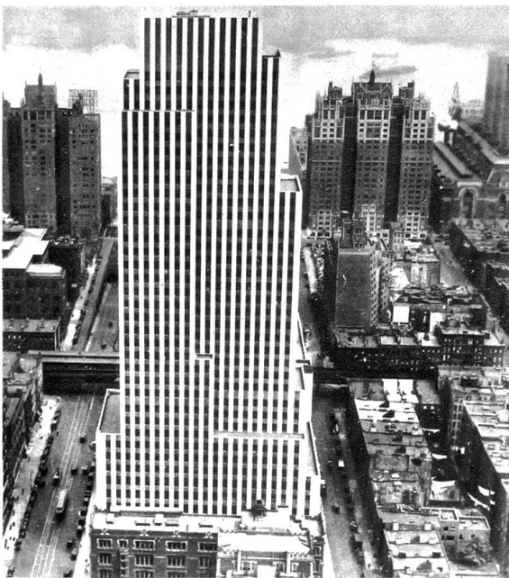
Das Gebäude der Daily News, aufgenommen vom Dach des gegenüberliegenden, 56 Stock hohen Chanin Buildings.