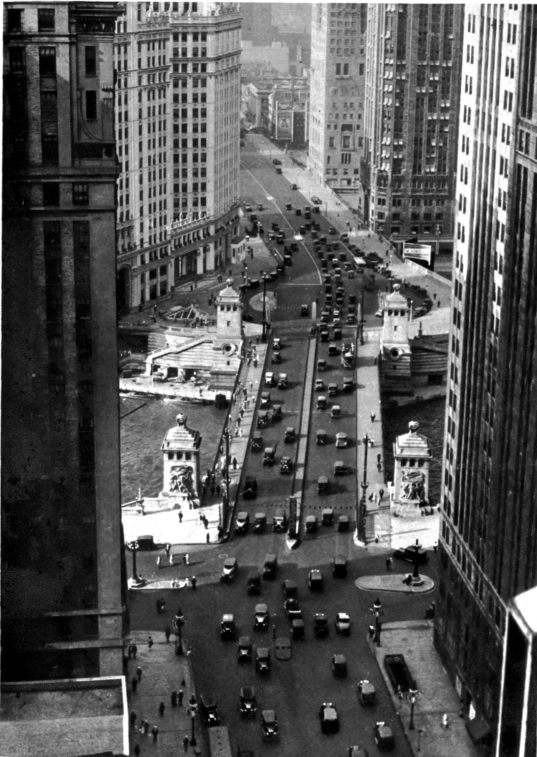
Blick auf die Michigan Avenue, Chicagos Hauptgeschäftsstrasse