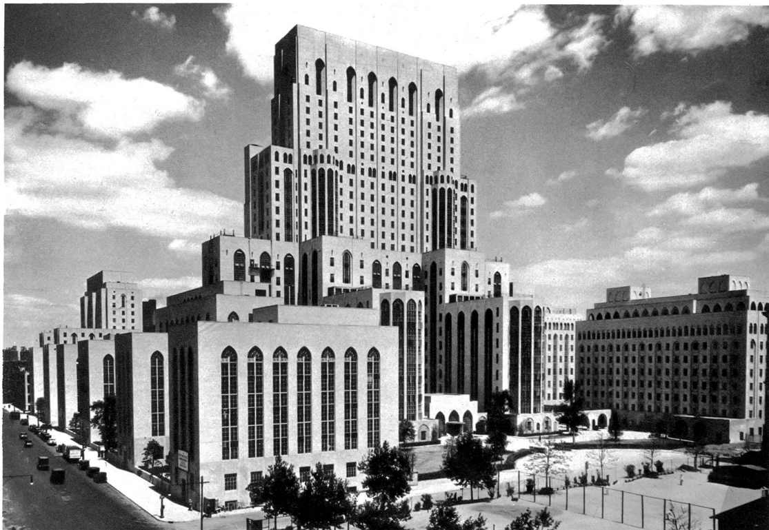
Das grösste Krankenhaus der Welt. Dieses riesige Krankenhaus steht am Ufer des East River in New York und ist das grösste Hospital der Welt. Es beherbergt gleichzeitig dreitausend Personen, Patienten, Aerzte, Medizinstudenten und Personal. Dieses architektonisch schöne und zweckmässige Krankenhaus erhielt die Goldene Medaille der Liga für Architektur