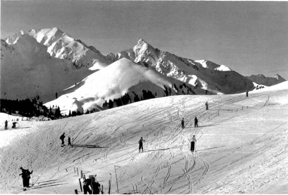
Bürglen — Birrespitz — Ochsen, mit dem herrlichen Skigelände am Selibühl

Zeit des Abschieds vom Gantrisch ist gekommen — — Ein Skifahrer nach dem andern startet. Dort kommt eine „Grindelwaldnergibe“ in rascher Fahrt daher. Einsam schreitet ein Wanderer in den sonnenglühenden Abend hinaus.