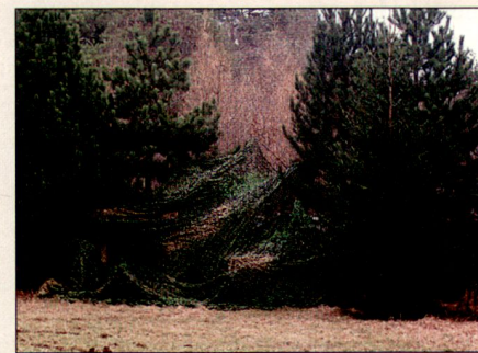
Ein M113 mit Tarnnetz in einer Waldlichtung.

In Europa wird der multispektralen Tarnung deshalb von wehrwissenschaftlicher Seite viel theoretisches Interesse entgegengebracht. Dieses Interesse mündet jedoch erst wenig in konkrete Beschaffungsentscheidungen. Im Rahmen der Beurteilung durch verschiedene internationale wehrwissenschaftliche Gremien in multinationalen Messkampagnen, durchgeführt durch Truppen der jeweiligen Länder und deren Fachabteilungen in den Beschaffungsämtern, zeigt sich regelmässig, dass das in der Schweiz entwickelte Tarnmaterial leistungsmässig an der Spitze steht. Das durch Auftragen mehrerer unterschiedlicher, dünner Schichten aufgebaute textile Material trägt den verschiedenen Erkennungssensoren in den spezifischen Wellenlängenbereichen Rechnung. Einerseits ist das Material dank einer patentierten wellen-