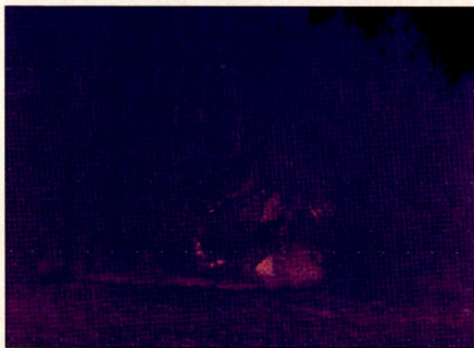
Wärmebildaufnahme (8–12 \mu ) von M113 mit Tarnnetz in einer Waldlichtung.

längenabhängigen Reflektivität in der Lage, die Signatur des getarnten Objekts im thermischen Infrarot zu reduzieren. Andererseits verfügt es im Radarbereich zwischen 2 bis 100 GHz über ausgezeichnete Rückstreuungseigenschaften.