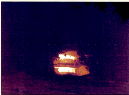
Wärmebildaufnahme (8–12 \mu ) von M113 ungetarnt in einer Waldlichtung.