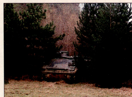
Ein M113 ungetarnt in einer Waldlichtung.

Die multispektrale Tarnung ist vor allem für Länder, die wie die Schweiz nicht a priori auf eine hohe Luftüberlegenheit zählen können und sich trotzdem gegen Aufklärung durch Satelliten, Flugzeuge und Drohnen schützen wollen, von grosser Bedeutung. Tarnung ist ein Schlüssel, um die Überlebensdauer von kostspieligen und komplexen Anlagen und Systemen signifikant zu erhöhen, ein Schlüssel zudem, dessen Kosten im Vergleich zu denjenigen der zu schützenden Objekte nur einen geringen Bruchteil ausmachen.