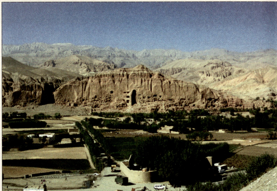
Blick über Bamyan auf das ehemalige, in den Fels gehauene buddhistische Kloster.

Bereits unter dem indischen Herrscher Tschandragupta drang 321 v. Chr. der Buddhismus nach Südafghanistan ein. Unter den Kuschan-Herrschern breitete sich der Buddhismus im 3. Jahrhundert nach Zentralasien und damit nach China aus. König Kanishka erklärte den Buddhismus zur Staatsreligion und begründete während seiner Herrschaft das Kloster von Bamyan. Das Kloster in diesem Hochtal wurde zu einer der heiligsten Stätten des Buddhismus. Aus ganz Nordwestindien kamen Mönche. Ihre Zellen errichteten sie im Fels. In die südliche Felswand meisselten sie zwei Kolossalstatuen des stehenden Buddhas, die Bamyan weltberühmt machten. Hinter der Felswand wurde ein System von Zellen, Heiligtümern, Gängen und Treppen errichtet. Die grösseren Höhlen wurden mit buddhistischen Fresken, bei denen die Mischung aus griechischer und indischer Tradition manifest wird, verziert. Auch über den beiden Buddhas wurden die Decken bemalt. Viele Merkmale er-