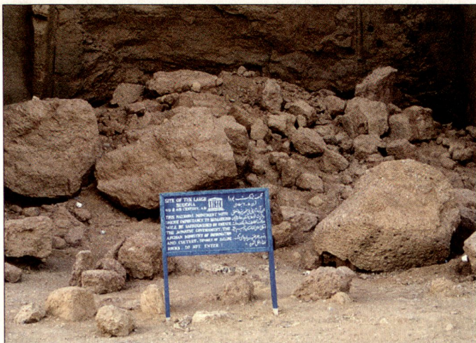
Von der UNESCO am Fuss des ehemaligen grossen Buddhas aufgestelltes Schild, das auf das zerstörte Weltkulturerbe hinweist.