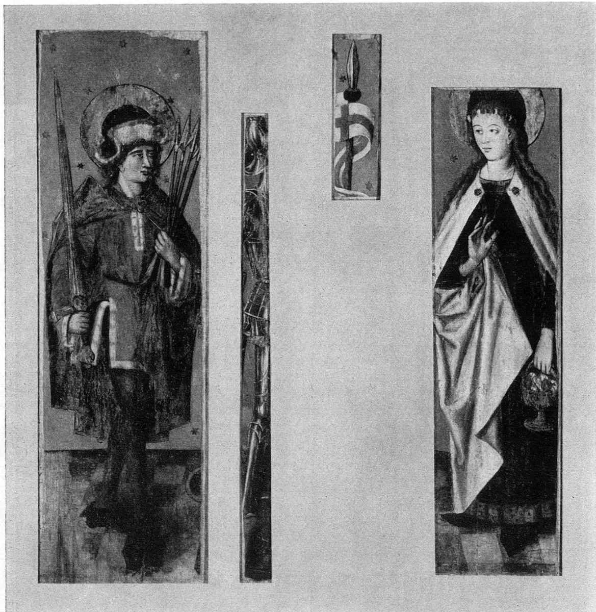
Abb. 2. Chur. Die Fragmente von der Werktagsseite nach der Freilegung