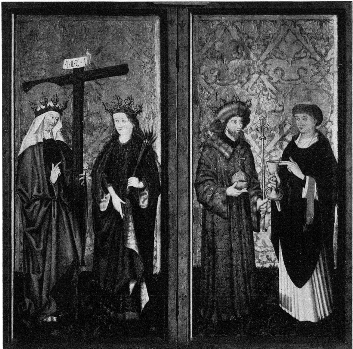
Abb. 3. Altarflügel aus Schmitten (vgl. S. 133)

Die Restaurierung der Tafeln erfolgte im Hinblick auf die Ausstellung im Museum nach vornehmlich konservatorischen Gesichtspunkten. Auf komplettierende Retuschen konnte deshalb verzichtet werden. Die Fehlstellen wurden lediglich bis auf die Holztafel bzw. unterlegte Leinwandstücke gesäubert und sodann in neutralen Brauntönen dem Charakter des gealterten Holzes und den Hell-Dunkel-Werten der umgebenden Farbpartien angepaßt.