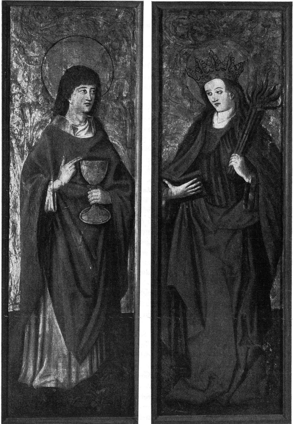
Abb. 1. Chur. Die neuerworbenen Flügel des Rätischen Museums vor der Restaurierung. Festseiten: die heiligen Florinus und Emerita