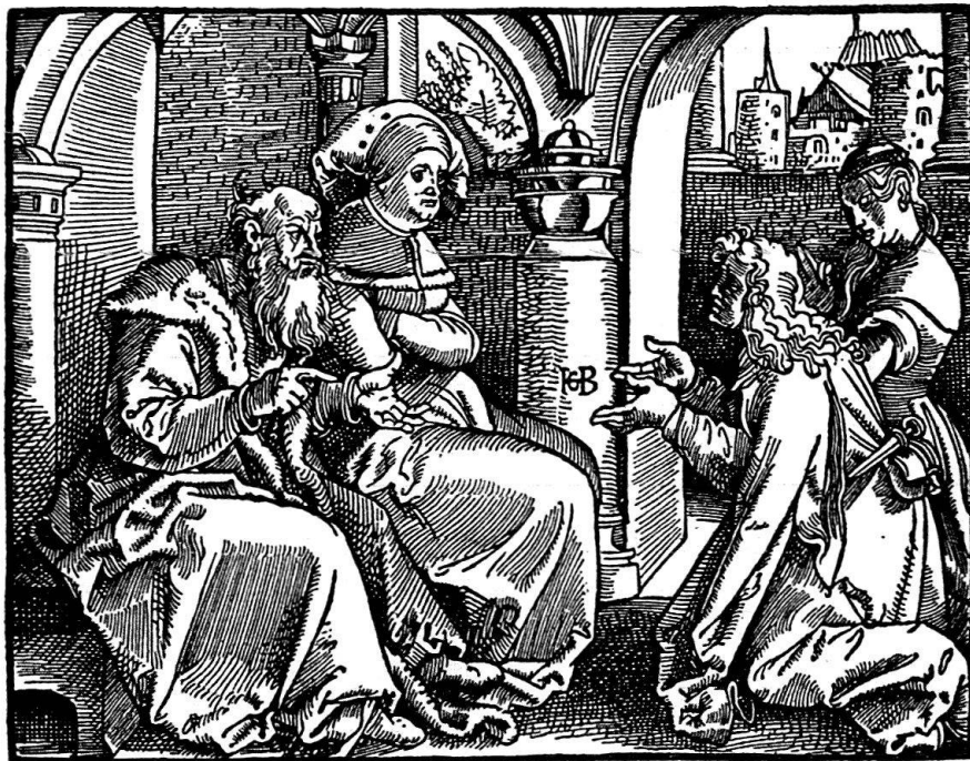
Das fünfte Gebot. Holzschnitt von Hans Baldung Grien. 1516

«Das Buch der Zehn Gebote», das einen Franziskanerbruder Markus von Lindau zum Verfasser hat, stammt aus der Spätzeit. Die Ausgabe erschien 1516 bei Joh. Grüninger in Straßburg und ist mit zehn breitformatigen Holzschnitten von Baldung Grien geschmückt. Unter der Meisterhand des Künstlers wird die Illustration zu den Zehn Geboten durch neue figürliche und räumliche Erfindungen in eine zeitgemäße Vorstellungswelt umgewandelt. Die Versinnbildlichung der Gebote bekommt nun einen frischen Zug. Baldungs Holzschnitte sind wiederholt verwendet worden, zum Beispiel bei den Predigten von Geiler von Kayserberg, was die Beliebtheit der Bilderfolge unterstreicht. Noch bis