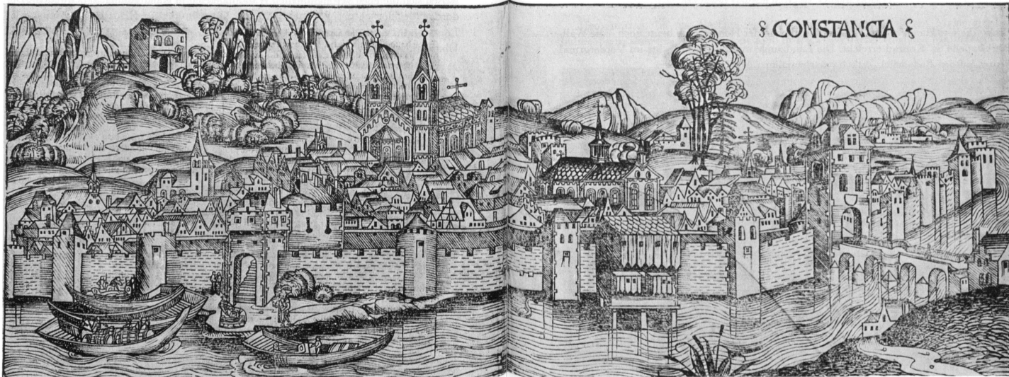
Abb. 1. Matthaeus Gutrecht d. Ä. (?). Konstanz. Holzschnitt

Mit der Wirklichkeit stimmt im allgemeinen die dargestellte Lage der Stadt überein, so die Haupt- oder Ostfront am See, die nördliche Seitenfront (mit dem Rheintorturm und der steinernen Brücke) am Seerhein und – im Hintergrund – der Untersee mit Burg Gottlieben (links vom Baum) und der schweizerische Seerücken. Auf den Seerücken führt