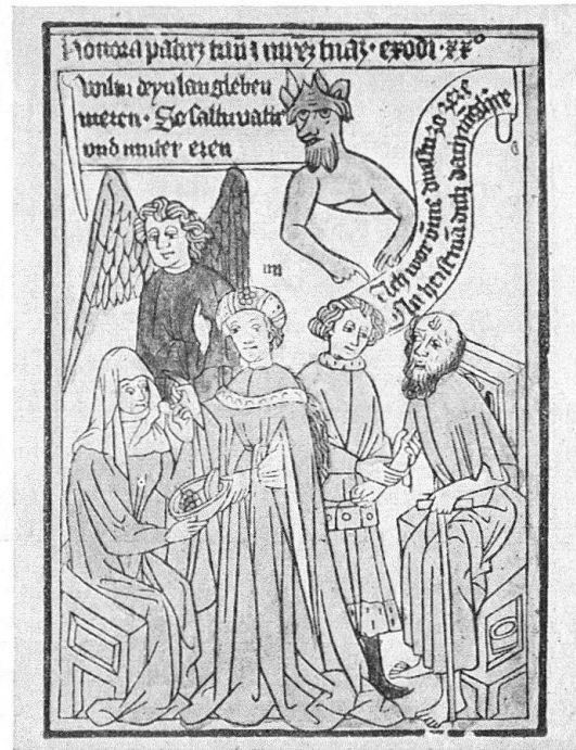
Zwei Blätter mit Darstellungen der Zehn Gebote. Decalogus, Codex Palat. germ. 438 der Heidelberger Universitätsbibliothek. Mitte 15. Jh.