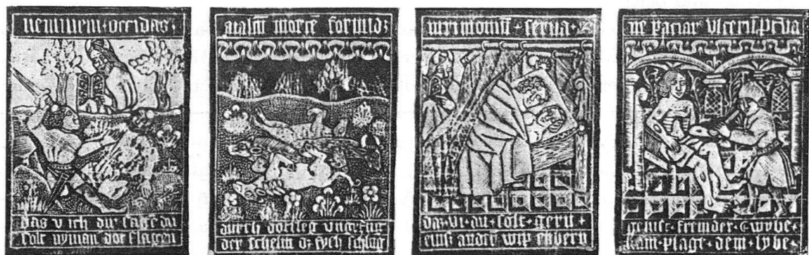
Darstellungen der Zehn Gebote und der ägyptischen Plagen. Oberrheinische Metallschnitte. Um 1475

Über die Volksbücher haben die Zehn Gebote Eingang in die malerische Ausstattung der Kirchen gefunden. Es darf angenommen werden, daß der Maler in Muttenz graphische Blätter als Vorlage verwendet hat, wofür die übersichtliche Komposition und die vereinfachte Raumkulisse sprechen. Die nachfolgende Aufzählung von Buchillustrationen, Holz- und Metallschnitten belegt den häufigen Gebrauch des «Beichtspiegels» für den christlichen Unterricht. Übrigens war es Sitte, die käuflich erworbenen Blätter an Wand und Türen zu befestigen, in Erfüllung der Gebote Gottes nach 5. Moses 6, 9: «Du sollst sie über deines Hauses Pfosten schreiben und an die Tore». Für zwei Druckwerke besitzen wir den Beweis, daß sie an der Mauer angeheftet waren: die Münchner Beichttafel von 1481 und der Zürcher Wandkatechismus von 1525. Somit wäre das Wandbild eher ein Ersatz für die Drucke auf Papier als ein Gemälde im Stil der Monumentalmalerei. Weisbach