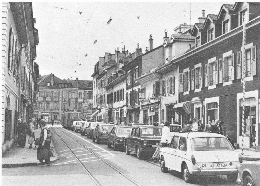
Carouge GE, ville d'importance nationale. Dans la mesure où il s'agit de l'une des rares villes importantes ne présentant pas de noyau médiéval, Carouge, dont la planification et la réalisation remontent au XVIII e siècle, justifie sans la moindre hésitation une classification nationale, du fait en particulier de la présence d'un système de voies et de places clairement défini et de la conservation de nombreux tronçons de rue encore intacts, avec les bâtiments qui les délimitent.

Jacques Vernet, Président de la Conférence suisse et Conseiller d'Etat chargé du Département des travaux publics du canton de Genève (jusqu'à fin 1981).