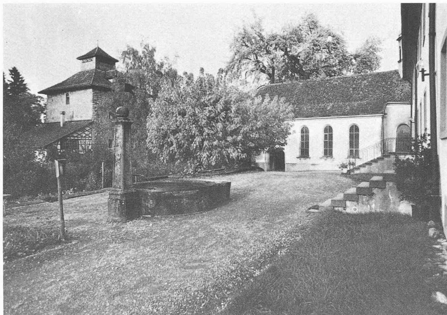
Pfäffikon-Unterdorf (commune de Freienbach) SZ, cas particulier d'importance nationale. Ce groupement minimal composé d'une chapelle, d'un château et de l'ancienne résidence du gouverneur, bordant la partie supérieure du lac de Zurich, a reçu une classification en tant que cas particulier d'importance nationale. Cette classification se justifie par le fait que la relation entre les bâtiments — importants sur le plan de la conservation des monuments — et leur environnement peut être garantie en premier lieu par un instrument de la sauvegarde des sites. L'ISOS se prête particulièrement bien à l'appréhension de cette qualité.

Zoug et dans les deux demi-cantons de Bâle, les sites construits ont été évalués dans un district au moins. Cela ne signifie cependant pas que tous les cantons ont déjà été inventoriés, ni même que les relevés des sites construits sont déjà prêts à être mis en consultation. Outre les inventaires mis en vigueur dans les cantons de Genève, Zurich, Obwald, Schwyz et Uri, le processus de consultation est engagé dans les cantons de Neuchâtel, Glaris et Appenzell et prévu pour 1982 dans les cantons de Schaffhouse, Argovie, Lucerne, Valais, Soleure et dans l'Oberland bernois.