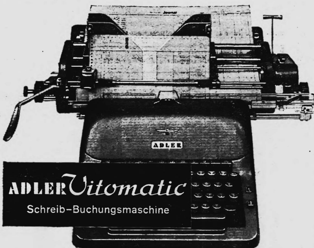
ADLER Vitomatic Schreib-Buchungsmaschine

Mit verbundenen Augen können Sie die Kontenkarte schreibfertig, zeilengerade und auf die richtige Buchungszeile einstellen. Kein Richten — ein Hebelzug genügt!