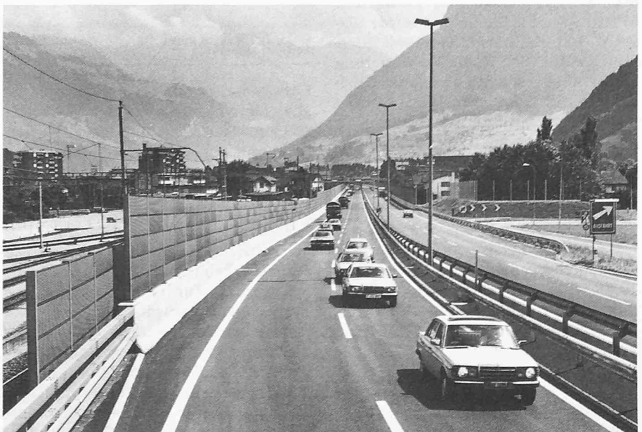
Bild 1: N2 Stansstad, Ausbau Standspuren und Lärmschutz. Blickrichtung Süd

Auf der Seeseite musste die Mauer auf einer Länge von 350 m bis 1,50 m an den offenen N2-Kanal gebaut werden. Entlang der Bachschale wurden Kanaldielelen gerammt, damit die Gefahr einer Flutung der Baugrube eliminiert werden konnte (Bild 3).