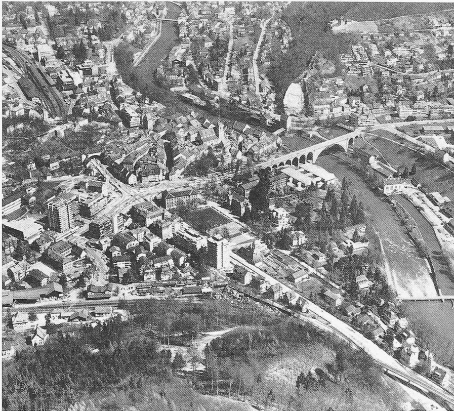
Baden. Altstadt, Schulhausplatz, Hochbrücke

Gutachter stellten fest, dass ja zwischen dem für den Rangierbahnhof vorgesehenen Areal und der Kantonsstrasse ein etwa 400 m breiter Streifen entstehen, worauf Industriebauten geplant waren. Die Aufzeichnung einiger Querprofile durch den Rangierbahnhof, das Industriegebiet und die südlichen Wohngebiete mit dreistöckigen Bauten ergaben, dass die Bauten in der Industriezone den Lärm für niedrige Wohnbauten vollständig abschirmen. Mit dieser Feststellung gab sich der Gemeinderat zufrieden. Der Rangierbahnhof wurde ausgeführt wie von den SBB geplant. Was geschah in der Folge? Statt aber dreistöckig zu bauen, wurde ein Hochhaus nach dem andern erstellt, und als der Rangierbahnhof in Betrieb genommen wurde und die Lärmmissionen sich auswirkten, kamen die ersten Reklamationen, weshalb die SBB zusätzliche Massnahmen ergreifen mussten.