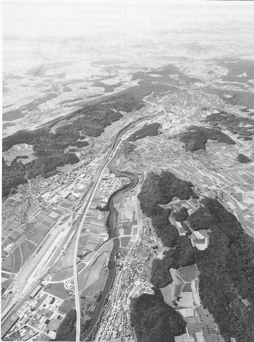
Aarg. Limmattal mit Rangierbahnhof und N1. Blick in Flussrichtung der Limmat

Die Schweiz. Vereinigung für Landesplanung wollte in den fünfziger Jahren wissen, welche Einwohnerzahl die Schweiz einmal aufweisen könnte. Im Sept. 1961 wurde an einer Tagung der VLP in Solothurn über die mögliche Zahl von 10 Mio berichtet. Auch Prof. Kneschaurek , früher Delegierter des Bundes für Konjunkturfragen, benutzte sie. Sie wurde ihm in der Rezession fälschlicherweise zum Vorwurf gemacht. Prognosen muss man als das ansehen, was sie sind, als Richtwerte bei denen viele Unbekannte später hineinspielen können. So löste der Ölschock von 1973 die Rezession aus, die Pille vor 15 Jahren den Geburtenrückgang, oder der vermehrte Wohnflächenbedarf pro Person, einen grösseren Bauflächenbedarf, das heisst, bei gleicher Ausnützung können auf einem gewissen Gebiet weniger Leute wohnen. Die Rezession ist vorbei und die Bevölkerung nimmt wieder zu, wenn auch langsam. Auf weite Sicht gesehen liegt eine gewisse Zunahme sicher im Bereich der Möglichkeit. Für eine Zahl von 10 Mio Einwohner müsste nämlich die heutige Bevölkerung nur um die Hälfte zunehmen, während sie sich seit 1900 verdoppelte. Bei der Projektierung kommen-