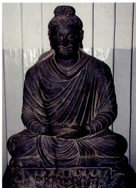
Rechts unten: Ein Buddha im National Museum von Kabul 2005 (in Reparatur).