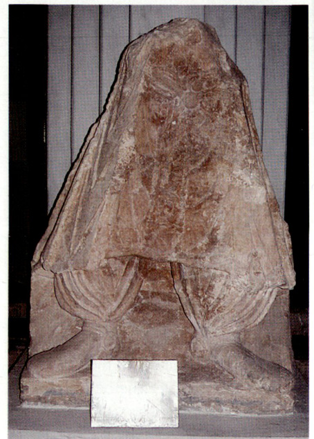
Mitte links: Der Unterleib des Kaisers Kanishka (Herrscher der Kushan 78–102 n. Chr.) im National Museum von Kabul vor der Zerstörung 1990.