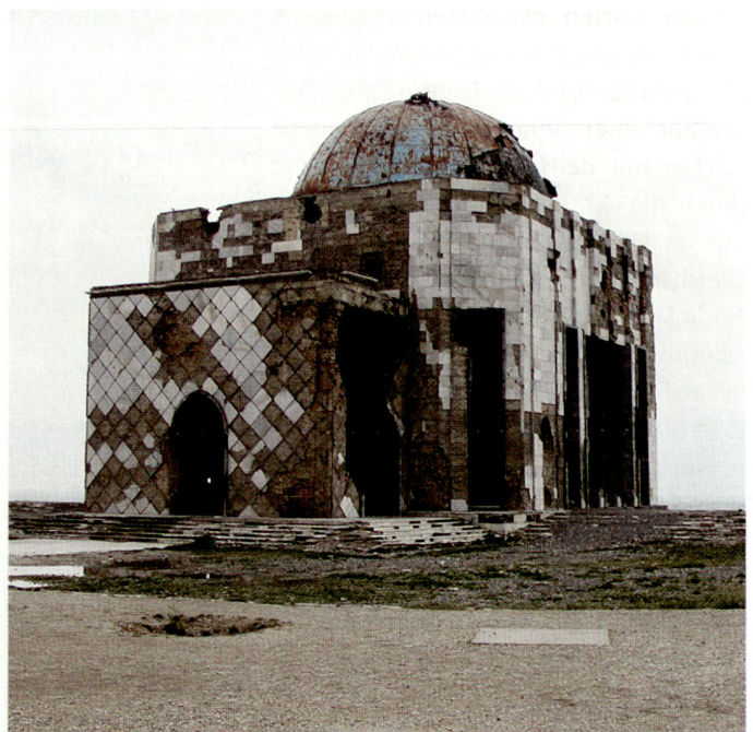
Grabdenkmal von König Nadir Shah.