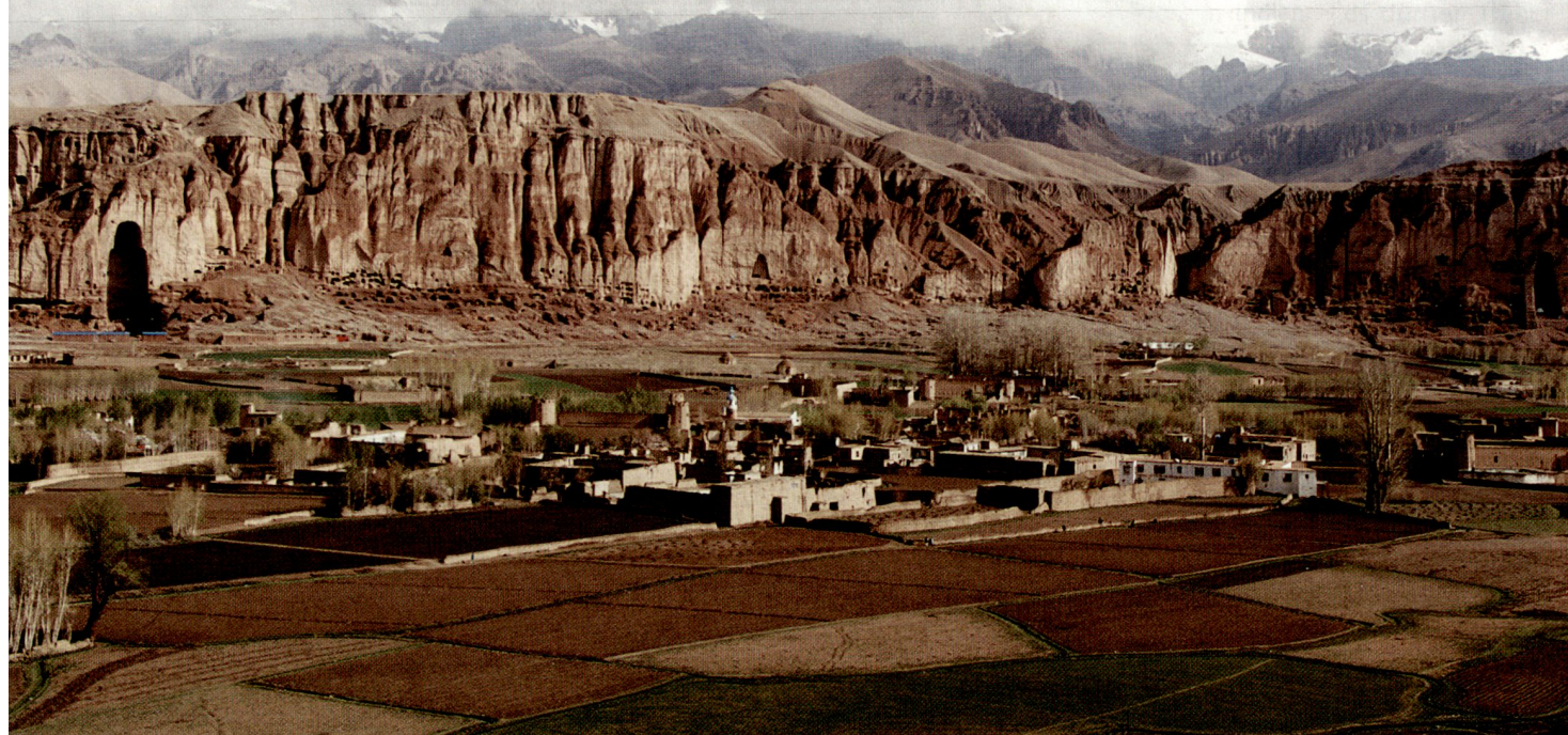
Unten: Die Wand mit den zerstörten Buddhas.