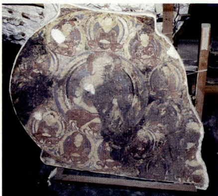
Unten: Buddha Mandala (Stuckatur) im National Museum von Kabul 1990 (aus dem 8. Jh. n. Chr. im Höhlentempel von Kakrak [Bamjyan] gefunden, heute verschwunden).

riode. Das Museum überstand unbeschadet die Zeit der kommunistischen Herrschaft. Allerdings befürchtet die Museumsleitung 1989 die Machtübernahme durch die Mujaheddin und bereitete den Abtransport der wertvollen Kunstgegenstände vor. Leider erklärte sich kein westlicher Staat zur Übernahme der Sammlung bereit. Mit der Regierung von Najibullah wollte keine westliche Regierung Beziehungen aufnehmen.