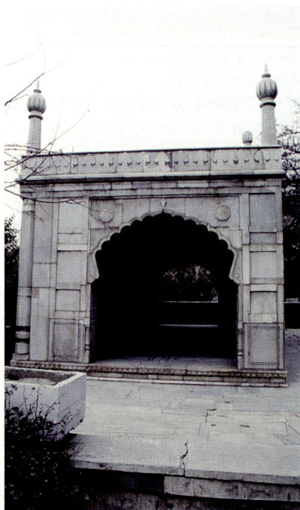
Unten rechts: Denkmal im Bagh-e Babur (restauriert) 2005.