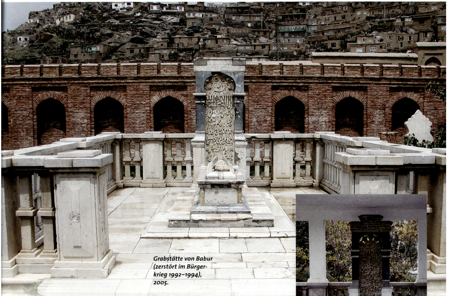
Grabstätte von Babur (zerstört im Bürger- krieg 1992–1994), 2005.