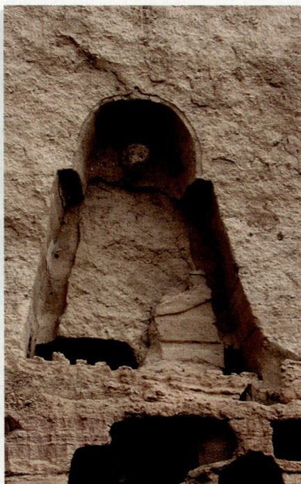
Oben links: Höhle eines mutmasslichen Bodhisattva (Anwärter einer künftigen Buddhaschaft) in Bamjyan.

Dr. Robert Stähli, Redaktionsleiter Ausland, Schweizer Radio DRS