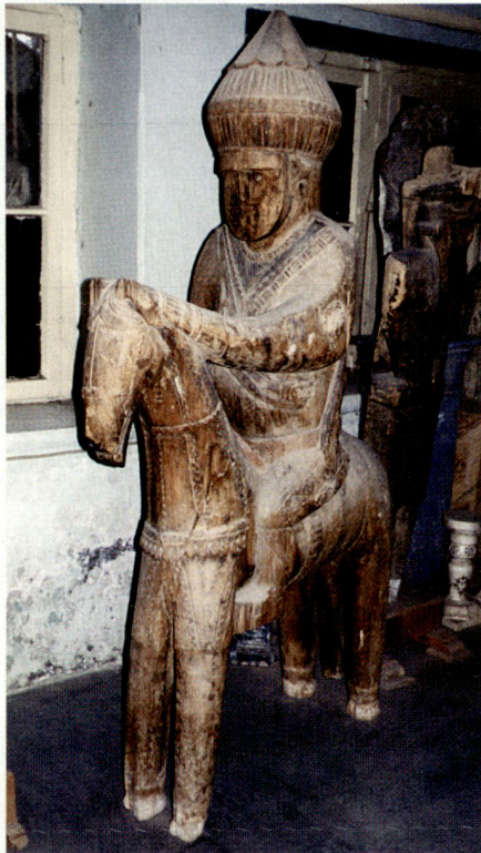
Oben links: Holzpferd aus Nuristan im National Museum von Kabul 1990.

Bereits 1919 wurde in Kabul im Bagh-i-Bala-Palast das erste Museum Afghanistans eröffnet. Dieses Museum enthielt verschiedene Manuskripte, Miniaturen, Waffen und andere Kunstobjekte, die der Königsfamilie gehörten. Einige Jahre später wurde die Sammlung in den Königspalast verlegt, und 1931 wurde das Museum im heutigen Gebäude eingerichtet, das früher der Stadtverwaltung diente und sich in der Nähe des Darulaman-Palastes befindet. Dieser beherbergte bis zum Bürgerkrieg (1992–94) das Verteidigungsministerium. Die Sammlung wurde ab 1922 durch die Ausgrabungen der «Délégation Archéologique Française en Afghanistan» (DAFA) angereichert. Später kamen die Funde weiterer archäologischer Teams dazu, bis schlussendlich die Sammlung Fundstücke aller Zeitperioden Afghanistans umfasste – von der prähistorischen, klassischen, buddhistischen, hinduistischen bis zur islamischen Pe-