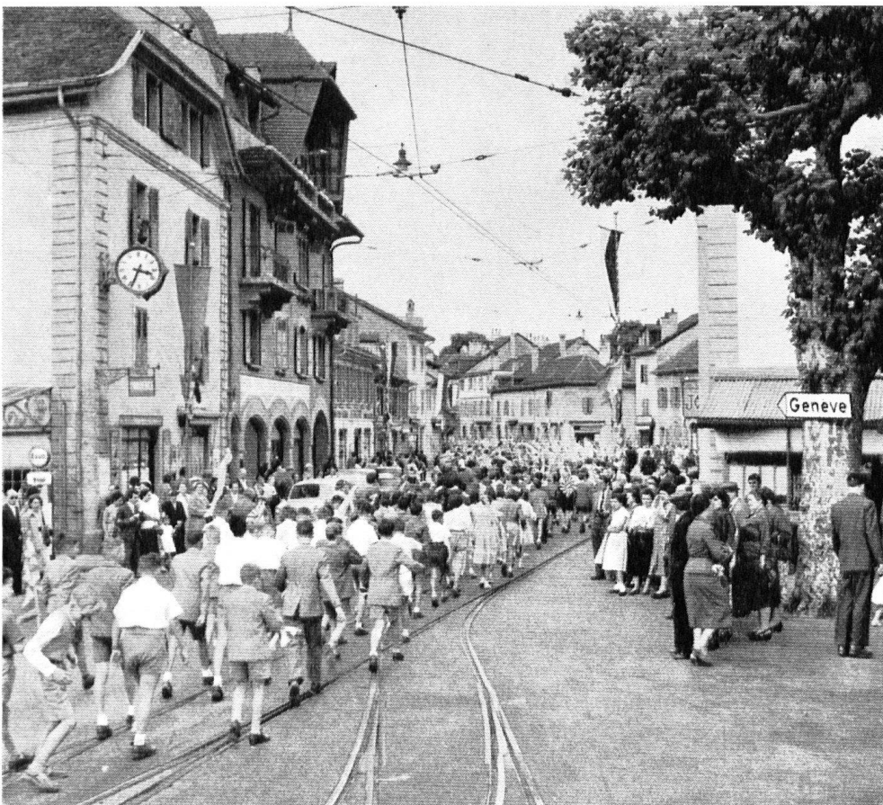
« Promotions » des écoles; entrée de la rue Ancienne, vue du Rondeau. L'immeuble de gauche, à façade courbe (1782) formait la tête de la com- position dans le 4me plan, celui de Robilant.