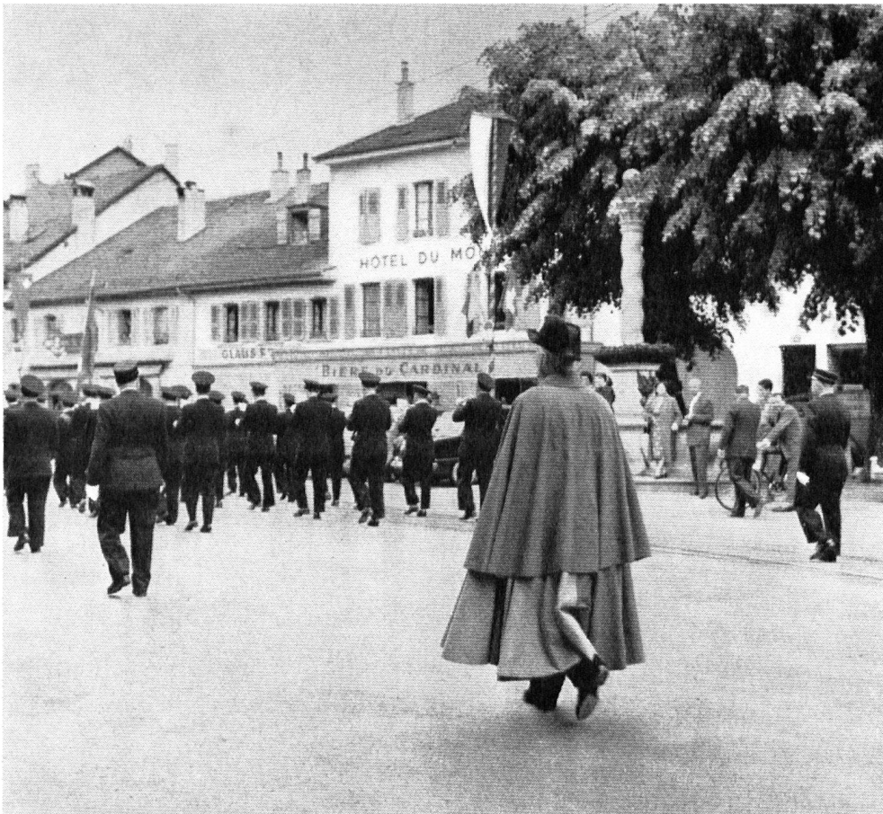
Fanfare municipale. Extrémité de la rue Ancienne, côté Rondeau. Maisons de 1778 et 1783. Fontaine de Blavignac.