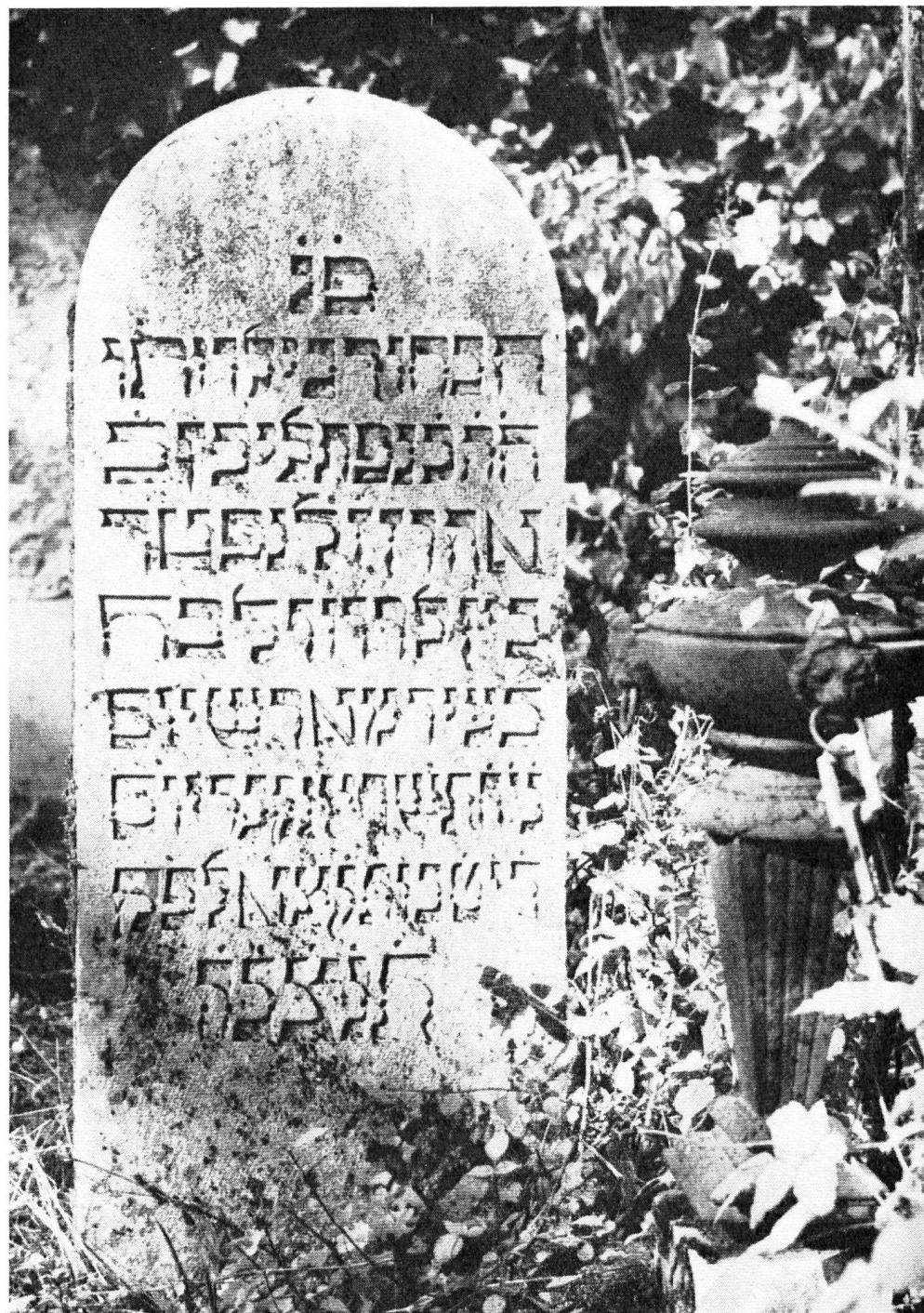
Pierre tombale, cimetière israélite. En août 1787, les Juifs obtiennent le droit d'habiter Carouge. On en comptait une quarantaine à la Révolution.

Il convient d'écarter d'emblée certaines méthodes, depuis longtemps condamnées par de hautes autorités internationales, dans le domaine de la rénovation urbaine. C'est ainsi que le pastiche est interdit à un architecte digne de ce nom, dans une époque créatrice. Or, nous vivons une époque créatrice. La restitution de Varsovie est l'exception qui confirme la règle. Les Allemands avaient détruit un cadre cher au peuple polonais – mais ce sont les Carougeois qui détruisent Carouge –.