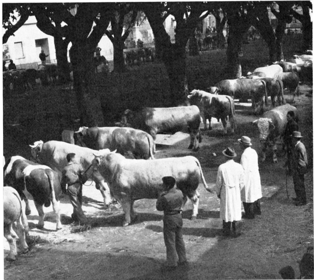
Marché au bétail, sur la même place.