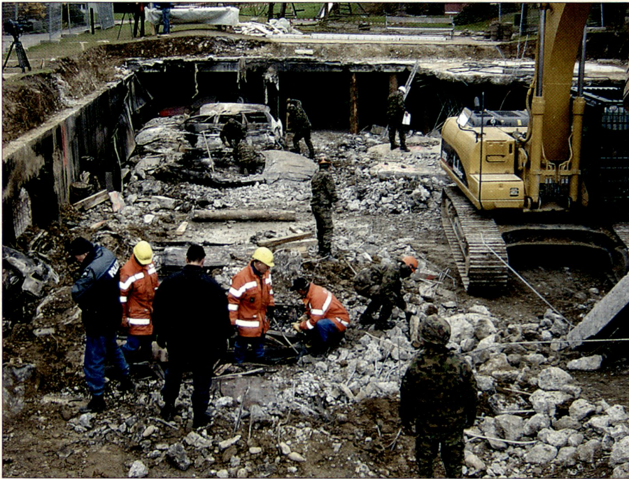
Einsatz des Katastrophenhilfe-Bereitschaftsverbandes in Gretzenbach (SO) nach einem Einstellhallenbrand 2004.