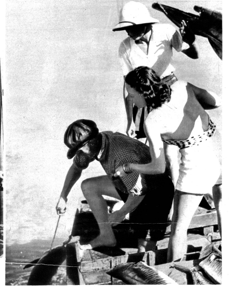
Makrelenfang vom Boot aus. Diese Fische sind bis zu 50 Pfund schwer