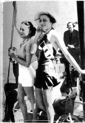
Auf dem Fischkutter der Küste entlang