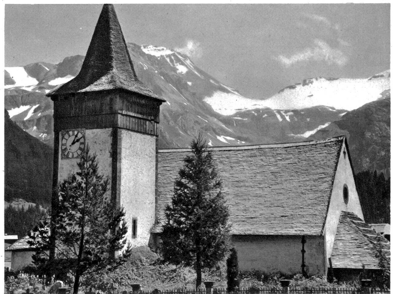
Kirche von Lauenen bei Gstaad