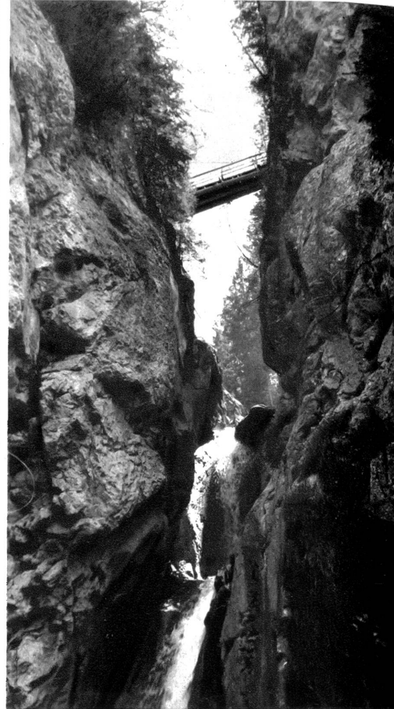
Gsteig bei Gstaad. Burgfälle. Arvenbrücke