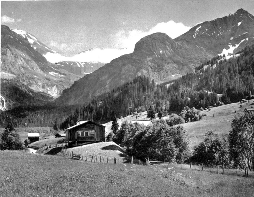
Das Tal von Lauenen

flachen Schindeldächern sozusagen ausnahmslos den Burgunderfamin, dessen schräg aufgestellter Windschutzdeckel von der Küche aus mit einer Kette oder einem Seil geschlossen werden kann. Der Küche dient dieser aus starken Bohlen gezimmerte Ramin als einzige Lichtöffnung. Von der sonst ganz dunklen Küche hat man Zutritt zu den übrigen Zimmern und Kammern des Hauses. Am Außern des Hauses nehmen sich die hübschen Treppenaufgänge mit ihren seitlichen Windschutzbrettern und die in Gruppen stehenden, ursprünglich mit Buzenscheiben verglasten Reihenfenster sehr gut aus. Besonders interessant sind auch die vielen Hausinschriften, die zumeist den Namen des Baumeisters und des Bauherrn, sowie des Werk- und Zimmermeisters tragen und daneben eine Art Schaugebete sind. Bibelsprüche und Abschnitte aus Kirchenliedern verwendete der religiöse Sinn der ursprünglich katholischen, dann unter dem Zwange Berns reformiert gewordenen Bevölkerung des Saanenlandes zur Ausschmückung der Hausprüche. Das Entziffern der in römischer Majuskelschrift ins Holz geschnittenen und seit dem 17. Jh. mit Fraktur schwarz aufs Holz aufgemalten, oft reich verchnörkelten Inschriften ist nicht leicht. Ferner sind die Frieze der Häuser rot, grün und blau, schwarz und weiß sehr hübsch bemalt. So ein auf der Sonnenseite rotbraun oder schwarz gebranntes, auf der Schattseite aber aschgraues Saanenhaus verrät den Wohlstand und die Liebe der Bevölkerung zur Ausschmückung ihres irdischen Wohnhauses.