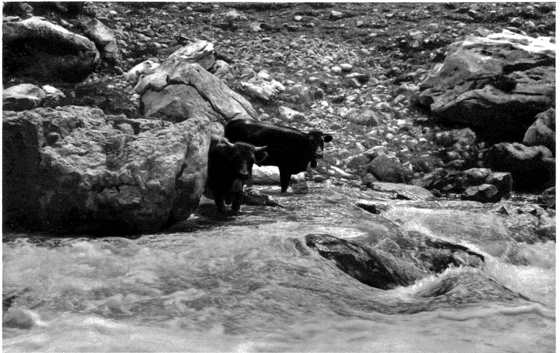
Gsteig bei Gstaad. Stierenberg. Eine Eringer Kuh und ein Muneli beim kühlen Bad in der Saane

Witwen nach der, vor dem Unglücksfall getroffenen vertraglichen Vereinbarung der Leute von Saanen mit ihren Baumeistern nicht sowohl den Kirchenbau fertig ausführen, sondern auch den erlittenen Schaden vergüten mußten. — Der Bau wirkt noch heute monumental, namentlich der schwere, achtfseitige Turmhelm, der als die älteste Form des Turmhelmes, eine gerade Pyramide mit hochinteressanter Holzkonstruktion, nur noch in Saanen erhalten ist. Der gewaltige Helm wird übrigens von 2½ Meter dicken Turmmauern getragen, was vermuten läßt, daß der Kirchenbau nicht nur als Gotteshaus, sondern auch als Zufluchtsstätte für Kriegszeiten geschaffen wurde. Eine hoch-