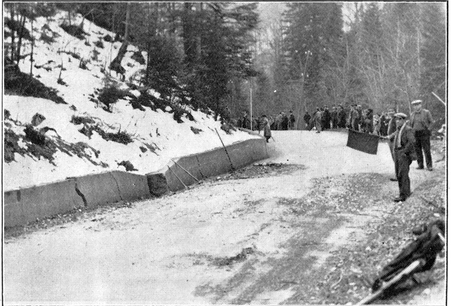
Der grosse Erdrutsch im Berner Jura

Ein Waldgebiet von schätzungsweise 500,000 Kubikmetern befindet sich bei Moutier seit einigen Tagen in bedrohlicher Bewegung. Bereits ist das Bahngelände derart zerstört, dass die Abrutschstelle nicht mehr passiert werden kann. Der Verkehr wird durch Umsteigen aufrecht erhalten. Das gefährdete, in Bewegung begriffene Gebiet befindet sich zwischen Moutier und Court.